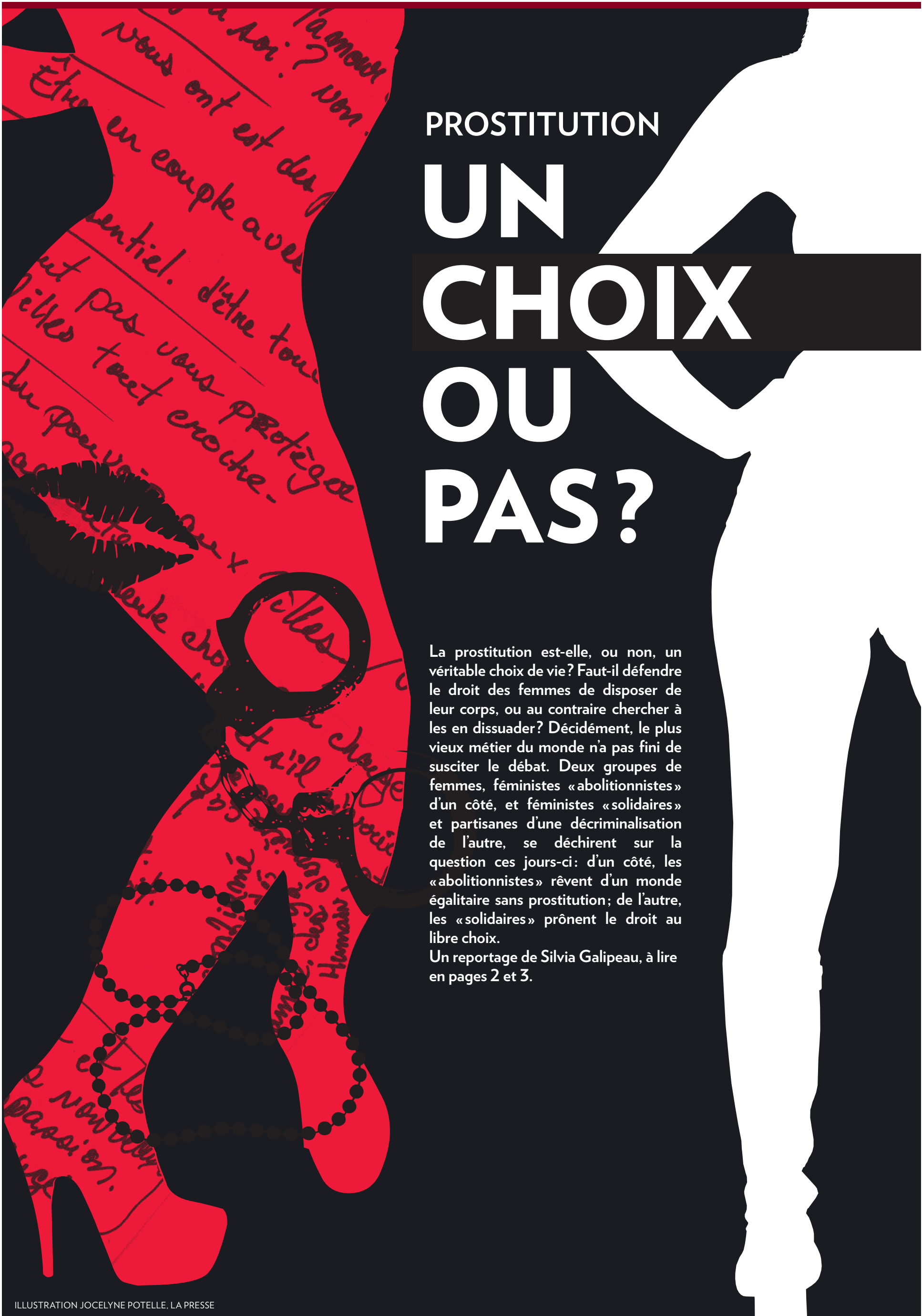
ILLUSTRATION JOCELYNE POTELLE, LA PRESSE

Un reportage de Silvia Galipeau, à lire en pages 2 et 3.