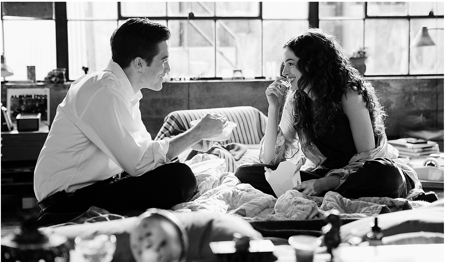
Faire un projet de vie avec l'autre implique de devoir modifier certains de ses projets individuels. Mais aimer, c'est aussi se donner la chance d'enrichir sa vie de ce qui sera créé avec l'autre.

Aimer comporte des risques. Se permettre de désirer l'autre, c'est aussi s'exposer à souffrir de son refus. Concevoir de