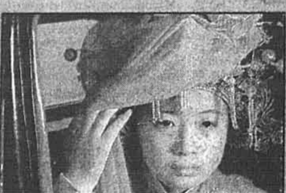
Le palanquin de larmes