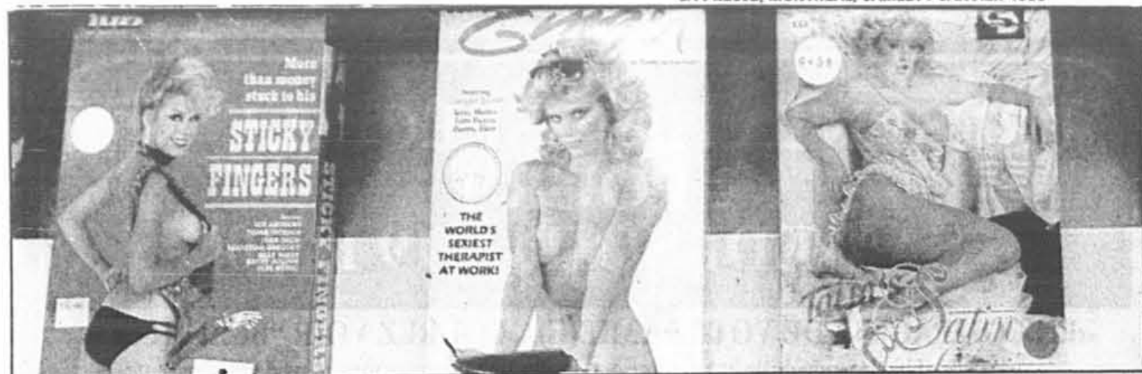
«Nous avons des clients qui louent quotidiennement sept ou huit films érotiques, raconte une gerante de club vidéo.»