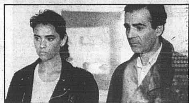
Mathilda May et Pierre Arditi.