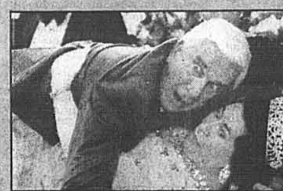
L'agent fait la farce