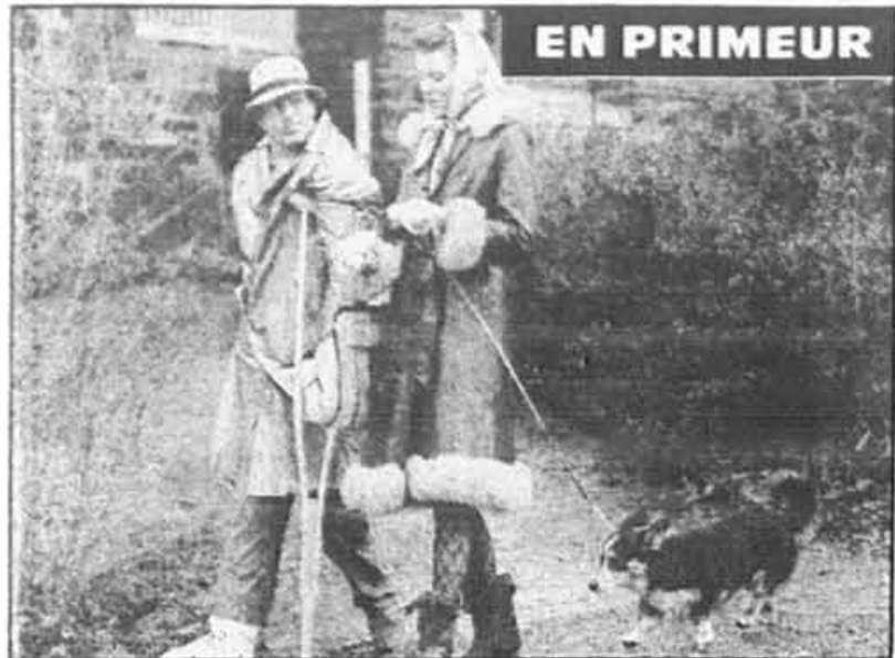
William Hurt et Geena Davis dans 'Accidental Tourist'.

■ Pelle le conquérant (Cineplex Centre-Ville 3) - Au tournant du siècle, les aventures d'un immigré et de son fils croyant trouver au Danemark la terre promise... Ils doivent déchanter. C'est du côté de l'Amérique qu'il faut regarder... Un excellent film. Avec Max von Sydow étonnant dans le rôle d'un vieil homme écrasé par