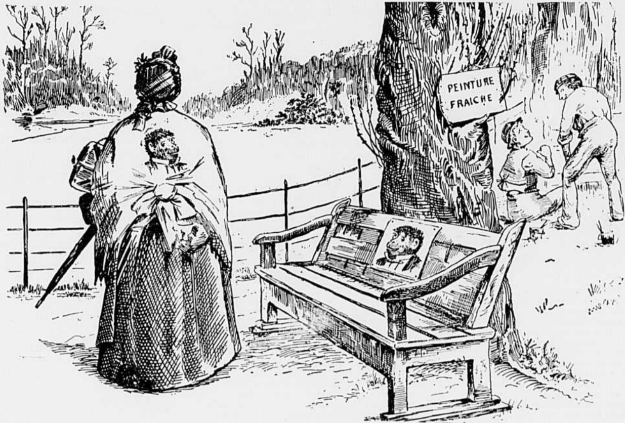
—Regardez donc ce singe de jardinier qui rit de moi avec l'autre. Je l'ai dans le dos.