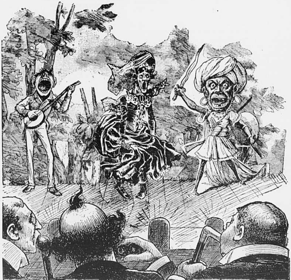
Le seul endroit où les vieux blasés peuvent se regaillardir.