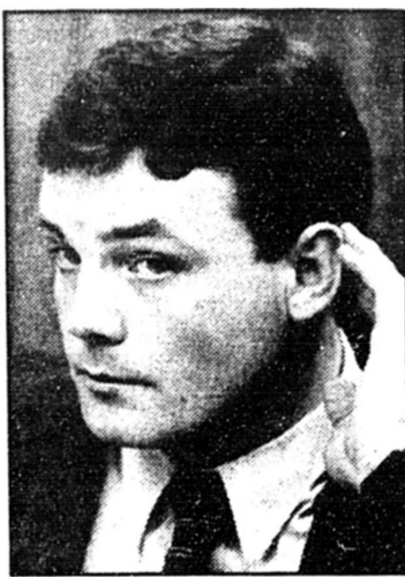
John Bobbitt était tout oule lors du procès de sa femme.

Par ailleurs, plusieurs témoins, dont des policiers et un chirurgien, ont raconté hier, avec force détails, comment ils avaient découvert la blessure sanglante infligée à John Wayne Bobbitt.