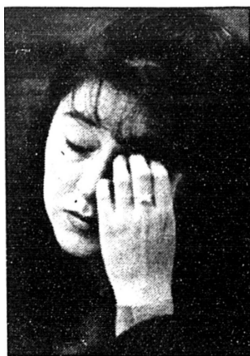
Lorena Bobbitt, lors de son témoignage hier.

John Bobbitt a énergiquement nié avoir agressé sexuellement son épouse. « Je ne l'ai jamais contrainte à faire l'amour... Jamais! », a-t-il affirmé dans sa deuxième déposition en deux jours. En novembre, il avait été acquitté de-