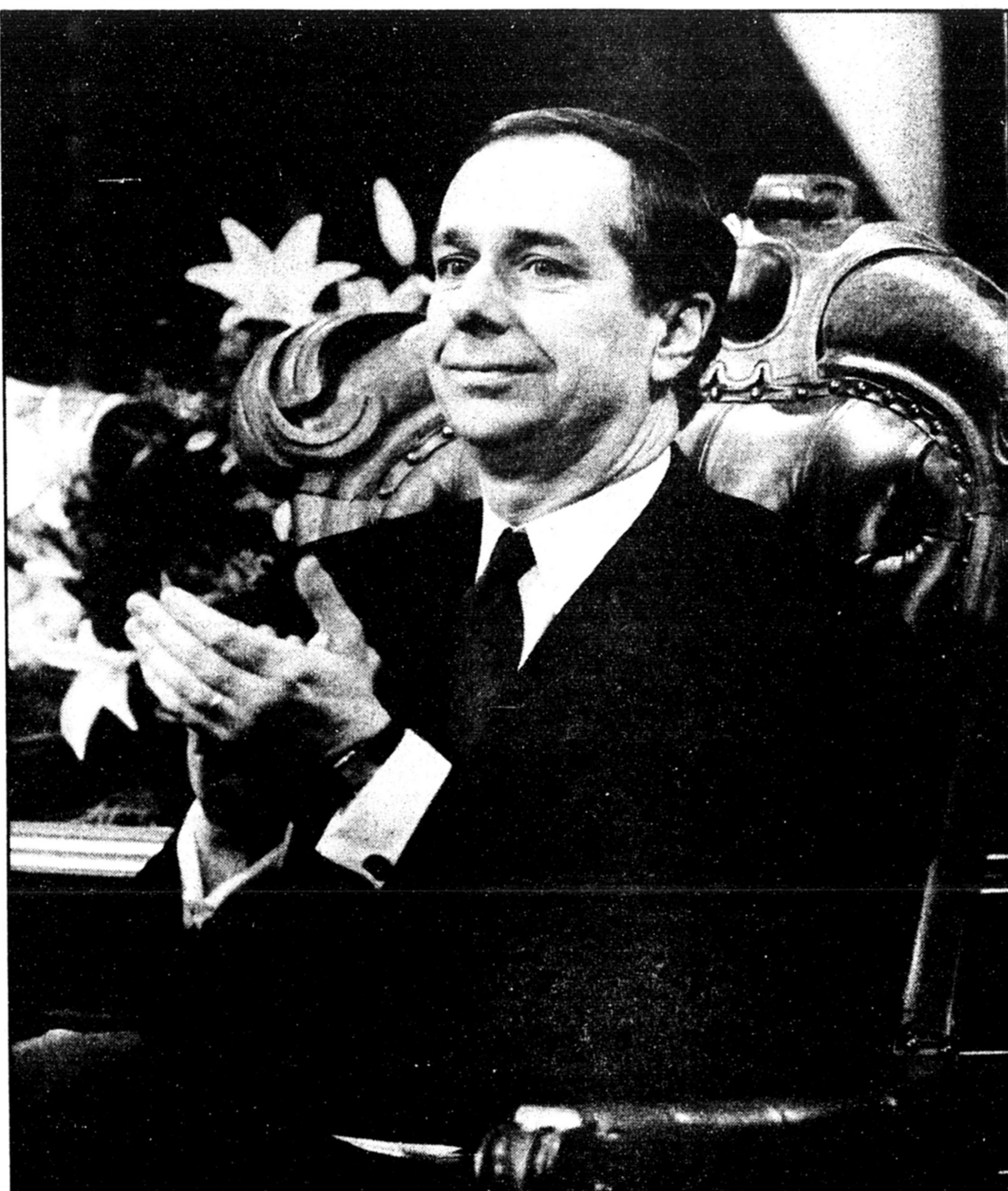
Daniel Johnson a rappelé le travail accompli par son prédécesseur, Robert Bourassa.