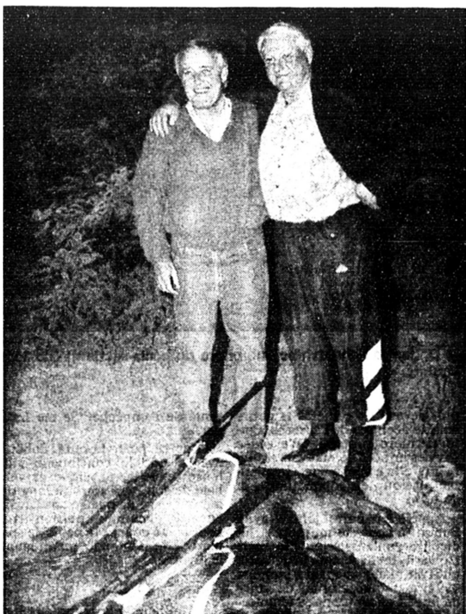
Au cours de sa tournée d'adieu, l'ex-premier ministre Mulroney avait, entre autres, chassé le sanglier avec Boris Eltsine.

Le nouveau gouvernement libéral, qui se veut plus frugal, a mis l'Airbus gouvernemental en vente. Le premier ministre Jean Chrétien ne l'utilisera pas.