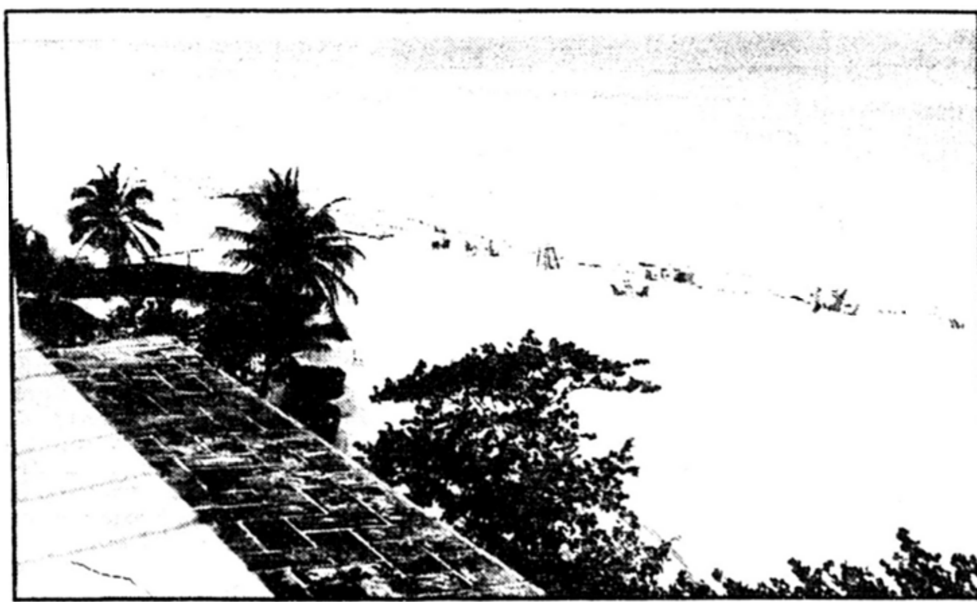
Les touristes canadiens peuvent continuer à se rendre à Cuba sans crainte.