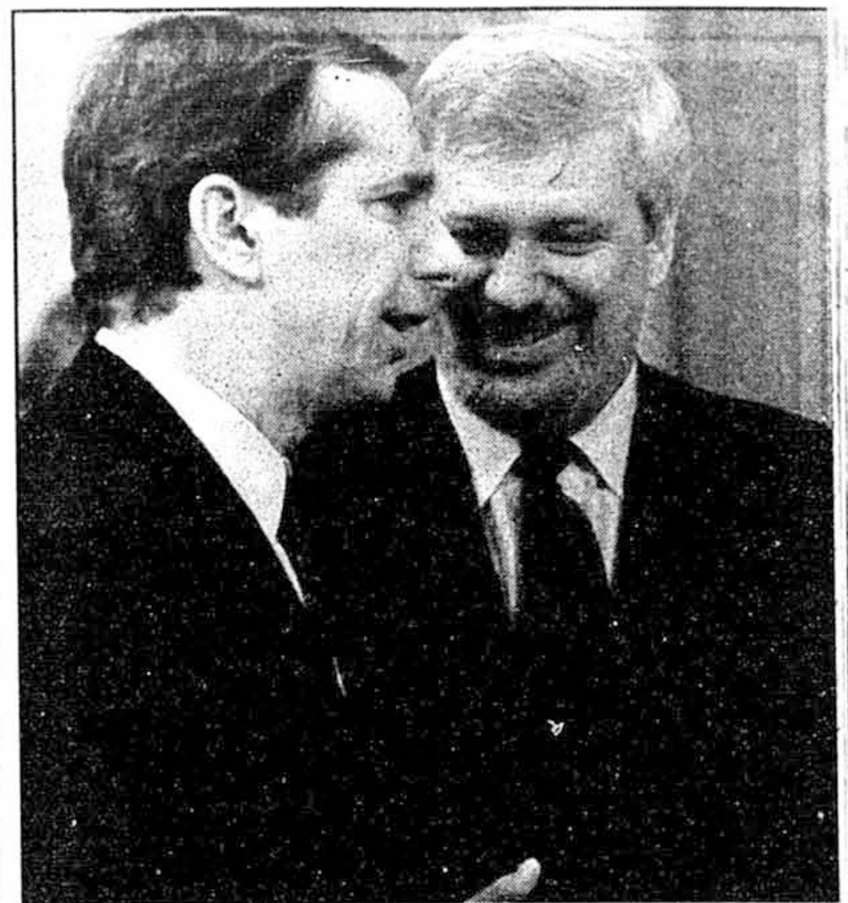
L'ex-premier-ministre péquiste Pierre Marc Johnson (à droite) a assisté hier à l'assermentation du nouveau premier ministre libéral, son frère Daniel.

Les liens du sang transcendent parfois les convictions politiques. Tout comme son père Daniel et son frère du même nom, Pierre Marc Johnson a fait l'expérience de l'exercice du pouvoir au plus haut niveau de la structure politique québécoise, comme premier ministre pendant sept semaines à l'automne de 1985.