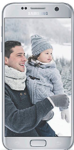
SAMSUNG Galaxy S7

À l'achat d'un appareil Samsung sélectionné, obtenez le Samsung Galaxy Tab E pour 0$. (avec un forfait flexible de 10$/mois minimum).