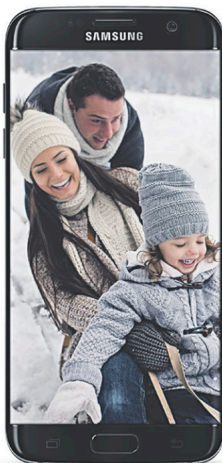
SAMSUNG Galaxy S7 edge