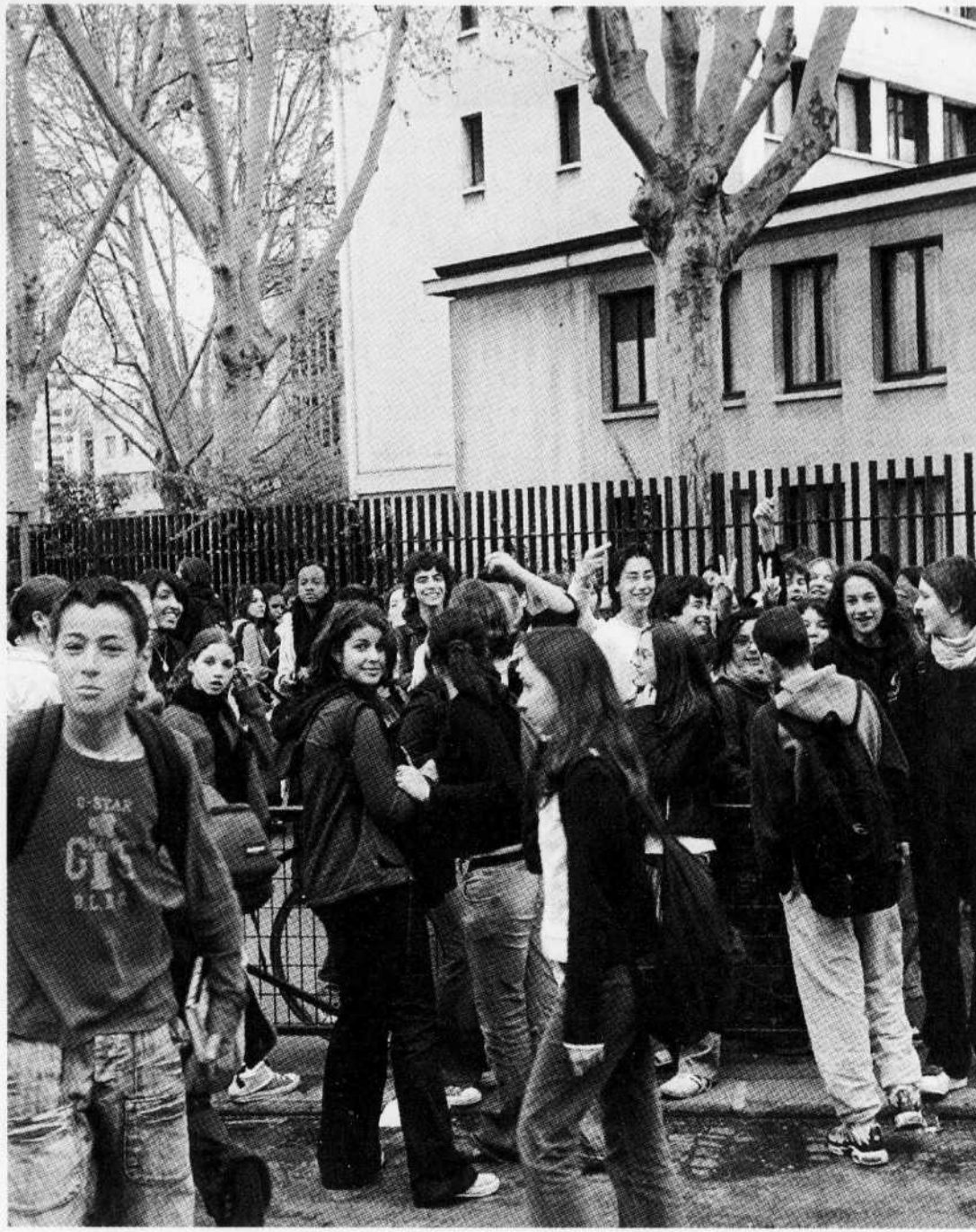
Pour la ministre de la Justice, Rachida Dati, une sanction pénale à partir de 12 ans correspond au bon sens.