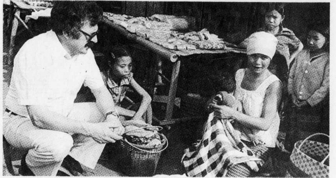
Le ministre Jacques Couture dans un camp de la Thaïlande, en 1980.

Ainsi, 518 groupes, répartis dans 215 municipalités partout au Québec, parrainent 7847 réfugiés jusqu'en mars 1981. Selon une enquête