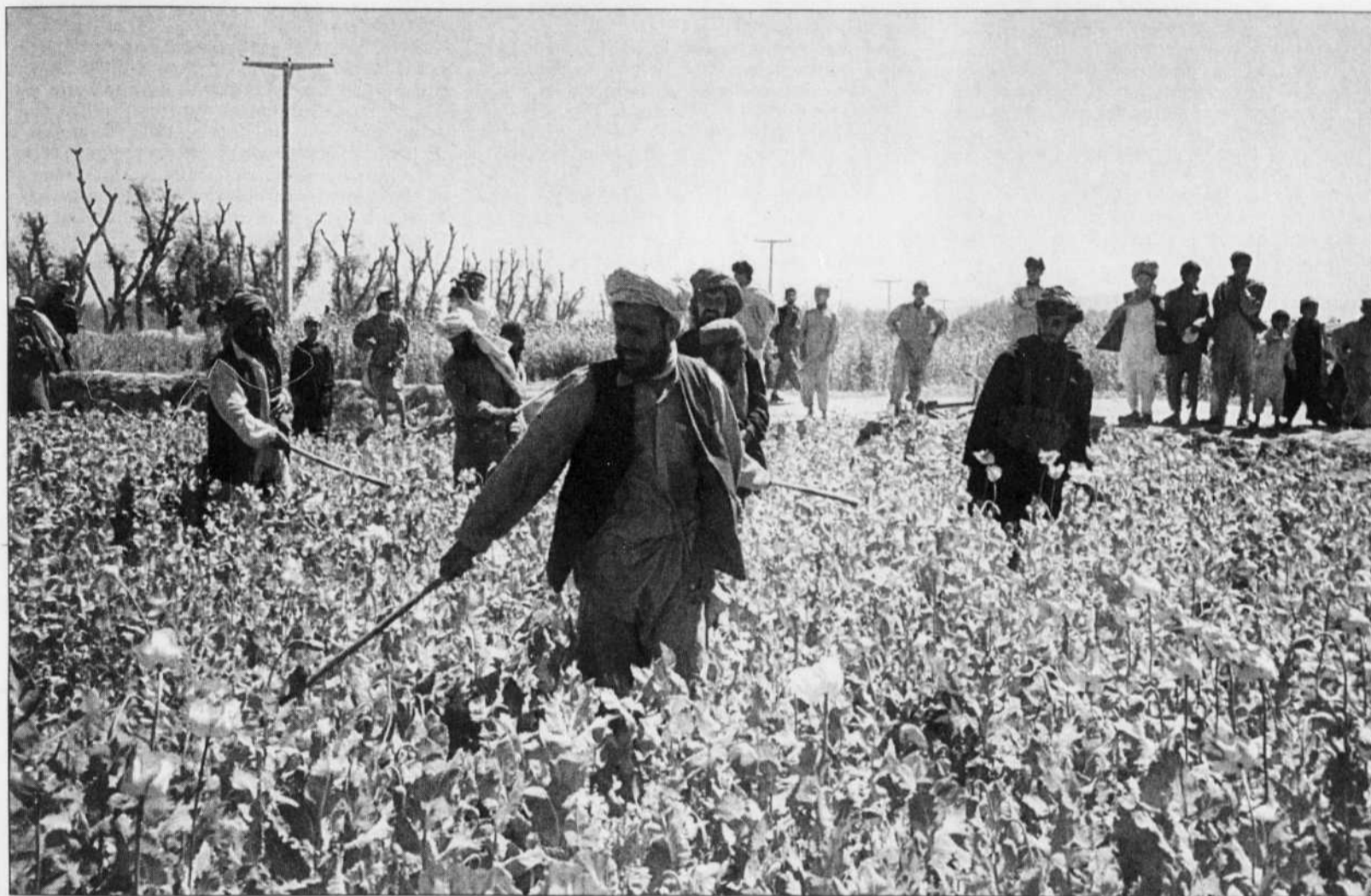
Destruction d'un champ de pavot dans la région de Jalalabad. Afin d'améliorer leur image auprès des États-Unis, les talibans avaient interdit, en juillet 2000, la culture du pavot dans les territoires sous leur contrôle et, selon le Programme des Nations unies pour le contrôle international des drogues, ils ont réussi à éliminer 96 % de la production d'opium. Avec la chute de régime de Kaboul, la situation a changé.