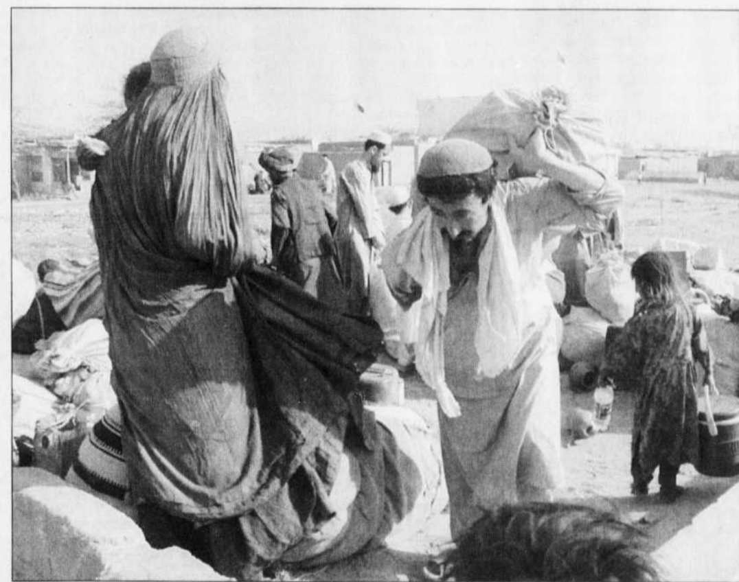
Les réfugiés afghans, comme ces résidents d'un camp des environs de Karachi, au Pakistan, continuent de rentrer au pays.

Les personnes arrêtées étaient sous surveillance depuis deux mois près de la frontière avec le Pakistan, a ajouté le responsable ministériel.