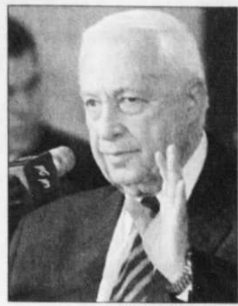
Nul ne sait ce que Sharon veut faire de la Cisjordanie.

Sur le terrain, la séparation est donc quasiment acquise. Pour beaucoup, ce ne serait qu'une première étape vers un «transfert» de populations (les colons juifs des territoires contre les Arabes d'Israël), seul moyen pour Israël de rester un Etat juif.