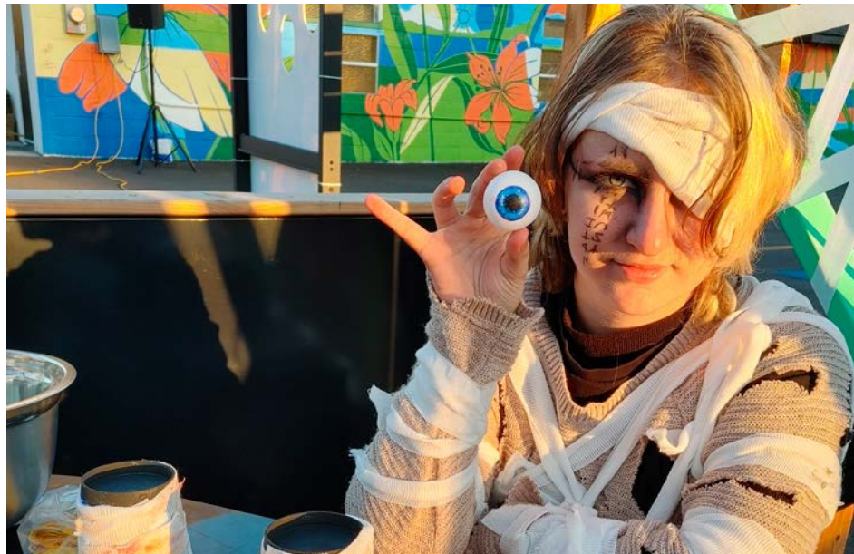
Plusieurs maisons hantées sont à visiter sur le territoire.

L'expérience immersive, réservée aux 13 ans et plus, plongera les participants dans un univers sombre et mystérieux, inspiré des légendaires sorcières. « En petits groupes de tout au plus six personnes, les visiteurs devront affronter leurs peurs à travers des décors terrifiants et des surprises effrayantes », explique la Ville. Les plus braves qui réussiront à sortir de la maison han-