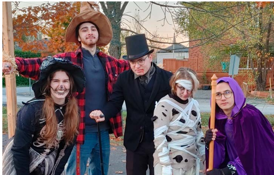
Du 25 au 31 octobre, les villes tenteront de divertir leurs citoyens à l'aide de multiples activités.

tée se verront récompensés par des bonbons. Cette maison hantée en est à sa quatrième édition. Elle est produite par la compagnie Cellule Creative, reconnue pour le Festival Frissons de Mascouche. Carignan mentionne que sa maison hantée a attiré en moyenne 200 personnes par soir lors des années précédentes. « Cette nouvelle édition promet de surpasser les attentes avec des sensations encore plus intenses que les années dernières », prévient la Municipalité.