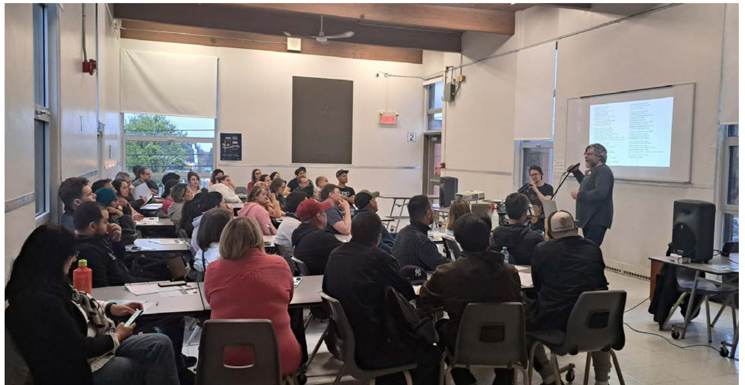
Les ateliers culturels de la SNQRL sont organisés depuis 2018.

Cette fois, les auditeurs deviennent téléspectateurs pour découvrir la télévision québécoise. « Nous voulons montrer aux gens comment consommer la télévision québécoise, poursuit la directrice générale. On veut montrer pourquoi, par exemple, le Bye Bye de