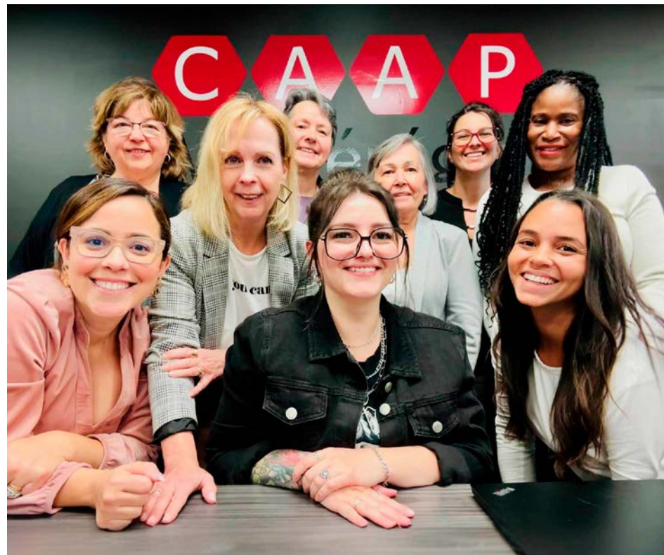
L'équipe du CAAP Montérégie.

Les demandes d'information et d'accompagnement étant en constante progression, le service s'est agrandi. « En deux ou trois ans, nous avons doublé l'équipe. Depuis 2019, depuis que nous aidons les locataires dans les RPA, nous avons doublé les demandes. Les dossiers RPA sont très long à monter. » Aujourd'hui, au total, l'équipe compte neuf em-