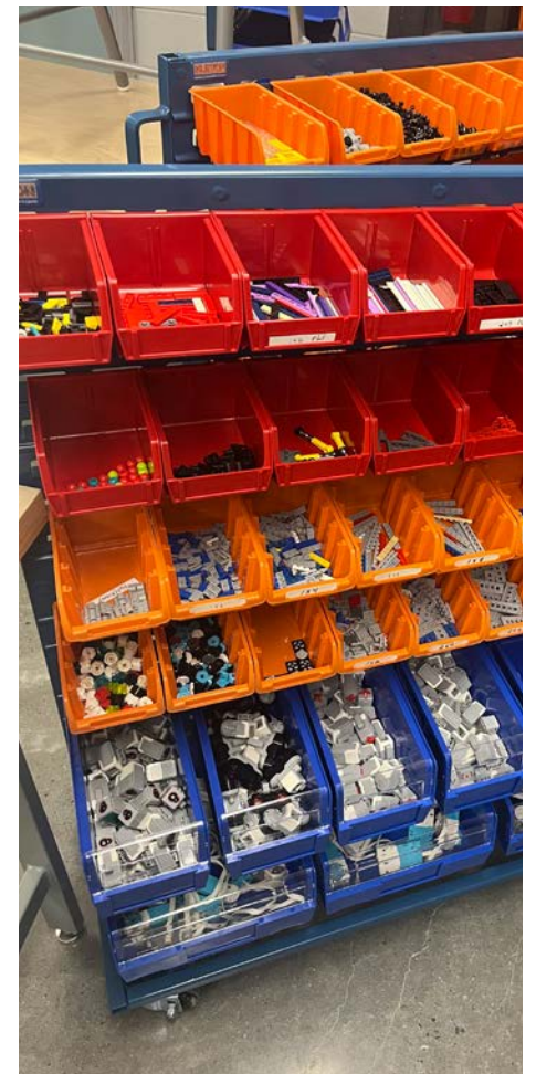
Après les événements de robotique, il faut replacer chacun des multiples morceaux utilisés au bon endroit.

dans une perspective d'avenir. Matisse se dirige vers une technique en génie mécanique, au cégep de Saint-Jean-sur-Richelieu. « Je vais plus axer sur la fabrication plutôt que sur la conception », prévoit-il déjà. Xavier vise la même