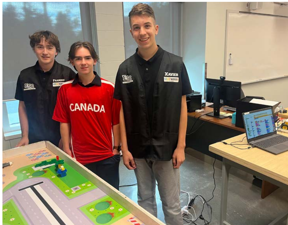
Les trois gars compétitionnaient pour la toute première fois dans la catégorie sénior.