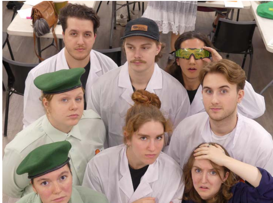
La troupe Les 25 cennes est composée d'anciens élèves du secondaire de Chambly.