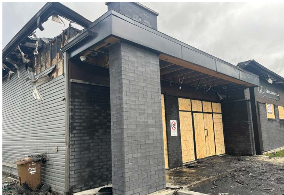
Le Gentleman club a déménagé en 2019.

Les dégâts sont importants. Au plus fort de l'intervention, une trentaine de pompiers ont été impliqués. Vers midi, les intervenants ont pu quitter la scène. Le feu a été maîtrisé sans endommager les bâtiments autour.