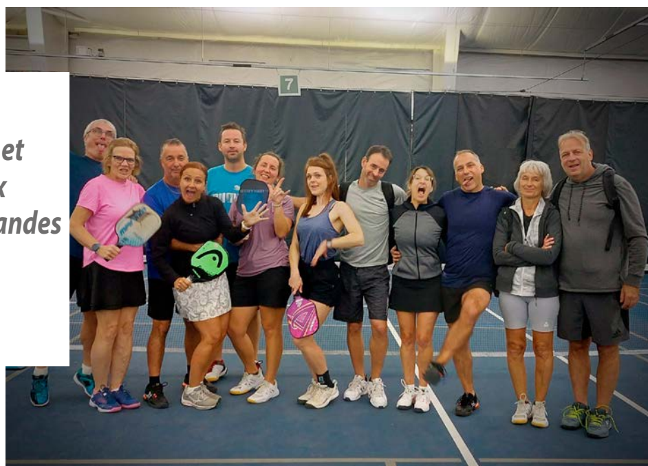
Au pickleball, on vient avec sa raquette... et son sourire!