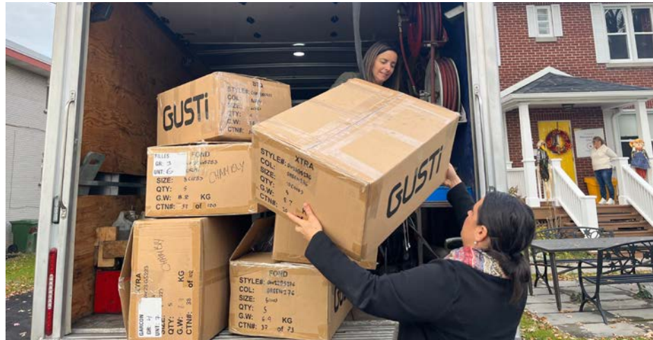
Le Carrefour familial du Richelieu a reçu une cinquantaine de manteaux.

« On remplit facilement le quota », renchérit Mme Rousseau. Elle ajoute qu'avec la venue du froid, des familles