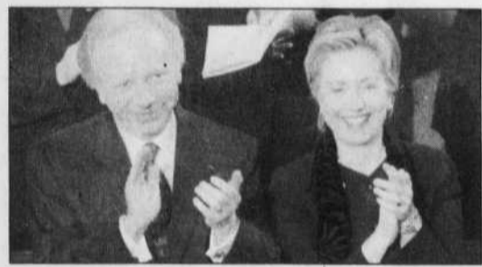
Les sénateurs démocrates Joseph Lieberman et Hillary Clinton ont assisté hier au discours de George W. Bush.

«On dirait que Bush est en amour avec sa propre audace», écrivait récemment l'éditorialiste David Corn, du journal new-yorkais de gauche The Nation . «Le 11 septembre a défini sa présidence. La guerre pourrait maintenant tout déterminer pour lui. Il a choisi de placer le problème irakien au sommet de sa liste de choses à faire. Il doit s'attendre à être jugé par les électeurs sur la façon dont il relèvera ce défi.»