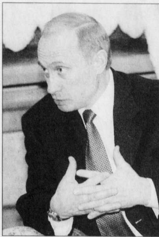
Le président russe, Vladimir Poutine, a prononcé hier un discours qui va dans le sens de la position américaine.

Selon un accord conclu avec les États-Unis, la Turquie accepterait que jusqu'à 20 000 soldats américains transitent par son territoire pour entrer dans le nord de l'Irak. Cinq mille autres seraient autorisés à stationner en Turquie pour fournir un soutien logistique à ces troupes terrestres, ont précisé des responsables américains sous le couvert de l'anonymat. Cet accord, qui doit encore recevoir le feu vert du Parlement turc, permettra au Pentagone de prévoir un second front en Irak en cas d'offensive militaire contre le régime de Saddam Hussein.