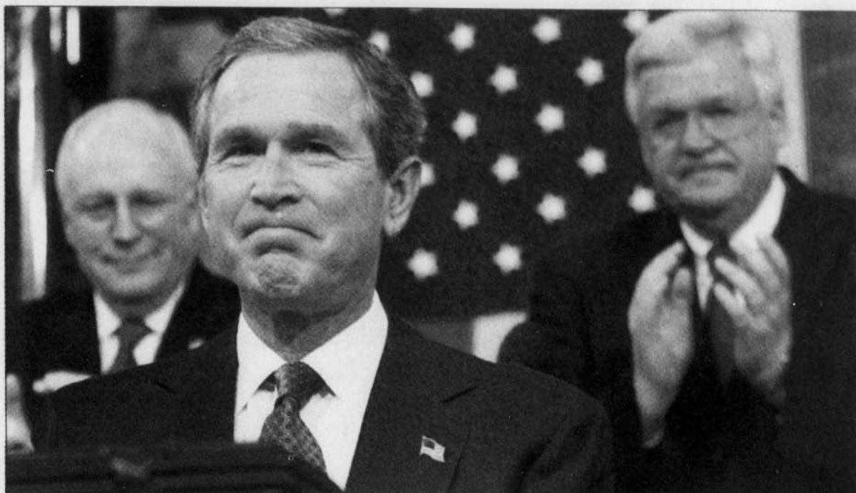
Le président américain George W. Bush est applaudi par les membres du Congrès peu avant de prononcer son discours sur l'état de l'Union, hier soir. Derrière lui se trouvent le vice-président Dick Cheney (à gauche) et le président de la Chambre des représentants, Dennis Hastert.