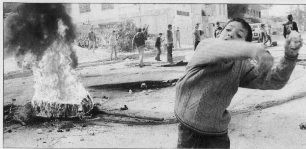
Un jeune Palestinien s'apprête à lancer une pierre en direction des soldats de l'armée israélienne dans la ville cisjordanienne de Naplouse. Hier, jour d'élections en Israël, la violence n'a pas fait relâche. À Jérusalem, en Cisjordanie, quatre Palestiniens ont été tués par des soldats israéliens dans des affrontements. À Gaza, trois Palestiniens sont morts dans l'explosion d'une maison, à la suite d'un tir de missile d'un hélicoptère israélien, selon des sources palestiniennes, ou du déclenchement prématuré d'une bombe artisanale, selon des sources militaires.

Le Devoir est publié du lundi au samedi par Le Devoir Inc., dont le siège social est situé au 2050, rue De Bleury, 9 e étage, Montréal, (Québec), H3A 3M9. Il est imprimé par Imprimerie Québecor St-Jean, 800, boulevard Industriel, Saint-Jean-sur-Richelieu, division de Imprimeries Québecor Inc., 612, rue Saint-Jacques Ouest, Montréal. L'Agence Presse Canadienne est autorisée à employer et à diffuser les informations publiées dans Le Devoir . Le Devoir est distribué par Messageries Dynamiques, division du Groupe Québecor Inc., 900, boulevard Saint-Martin Ouest, Laval. Envoi de publication — Enregistrement n° 0858. Dépôt légal: Bibliothèque nationale du Québec.