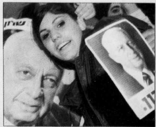
Une jeune femme manifestait sa joie à Tel-Aviv après la confirmation de la victoire du premier ministre Ariel Sharon, hier.