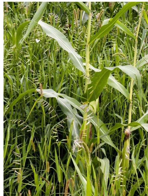
Figure 4 : Infestation d'ériochloé velue en champ de maïs

Bien que l'ACIA ait suspendu l'application de ses mesures réglementaires, les producteurs aux prises avec l'ériochloé velue sont fortement encouragés à mettre en place des pratiques exemplaires de gestion s'ils veulent réduire sa présence, limiter sa propagation et minimiser les pertes de rendement qu'elle occasionne. À cet effet, ces derniers doivent assurer un bon contrôle de la plante au champ et nettoyer la machinerie ayant circulé dans une zone infestée afin de la départir de la terre ou de tous débris végétaux qui auraient pu y adhérer 26 . Sa présence doit obligatoirement être déclarée à l'ACIA. Vous devez en informer le bureau le plus près du site de présence en consultant le site Web de l'ACIA ( www.inspection.gc.ca ) ou en composant le 1 800 442-2342 25 .