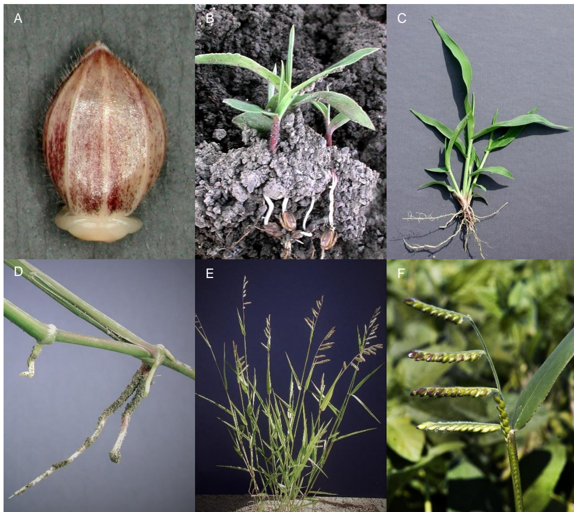
Figure 3 : Morphologie de l'ériochloé velue

Au stade 3 feuilles, la plantule initie la production des tiges secondaires 1 . En cours de saison, les tiges à la base du plant se développent en stolon. Cette propagation s'ensuit d'une allocation des ressources vers les parties supérieures de la plante 1 . La floraison débute entre la mi-juillet à août et se poursuit jusqu'à la sénescence du plant aux premiers gels 1 . Les premières inflorescences (panicules) s'érigent au sommet des tiges principales et secondaires, mais les inflorescences subséquentes, plus petites et en grand nombre, se développent directement à partir des nœuds inférieurs 1 . Ainsi, lorsque l'émergence a lieu en mai et en absence de compétition, un seul plant peut produire près de 60 tiges, comportant 900 panicules et totalisant près de 164 000 graines 10 . La production de graines est proportionnelle à la biomasse de la plante 11,12 et diminue exponentiellement avec l'avancement de la saison 10 . Bien qu'une légère diminution du nombre de branches par panicule (6,2 à 4,1 branches/panicule) et du nombre de graines par branche (34 à 12 graines/branche) soit observée, la réduction du nombre de graines par plant est surtout attribuable à la diminution du nombre de panicules et des tiges associées 10 . La dissémination des graines matures se réalise d'août à septembre 1 .