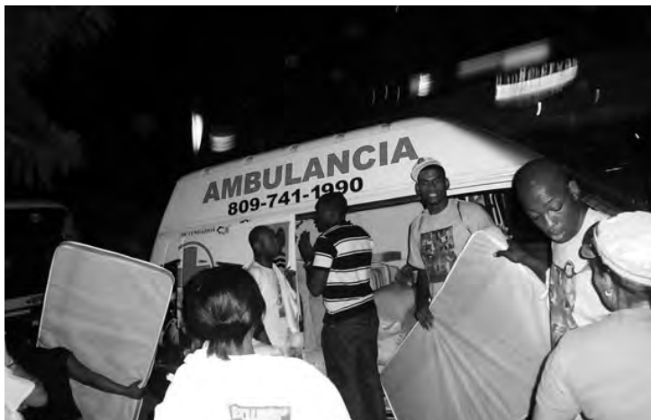
Un des convois organisés par MOSCTHA au lendemain du séisme du 12 janvier.

Les actions de coopération pour l'année ont été principalement axées sur le développement économique et la promotion de la bonne gouvernance. Les actions liées au développement économique consistent à promouvoir l'entrepreneuriat des micro et petites entreprises en mettant l'accent sur les femmes entrepreneures; à améliorer l'accès aux marchés, principalement aux biens de production (en particulier la terre, le capital et le crédit), aux activités de transformation et de commercialisation ainsi qu'à favoriser un contrôle accru sur ces éléments.