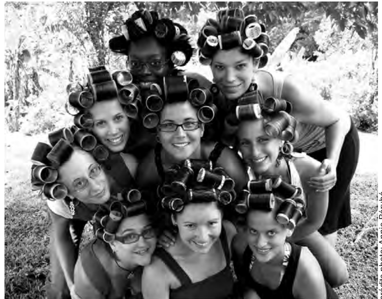
Les stagiaires du groupe Mujeres y cacao solidario en République dominicaine. C'est aussi ça l'intégration...

De plus, Plan Nagua a développé une expertise en offrant des stages de tourisme équitable pour des groupes de jeunes désirant vivre une première expérience de solidarité internationale. Un appui logistique et préparatoire est fourni par Plan Nagua afin d'outiller les groupes et leurs responsables. Pour en savoir plus sur les stages de tourisme équitable, communiquez avec l'équipe des stages internationaux à l'adresse stages@plannagua.qc.ca