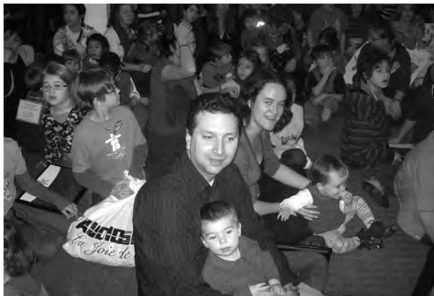
Plan Nagua et sa relève étaient présents à l'activité soulignant les 20 ans de la Convention des droits de l'enfant.

Dans ce même contexte, Plan Nagua a établi un partenariat avec le Théâtre jeunesse Les Gros Becs, qui a permis de sensibiliser les spectateurs aux droits des enfants, par le biais d'un atelier dans leurs classes à la suite du visionnement d'une création théâtrale sur le sujet. Un petit guide sur le thème des droits de l'enfant a aussi été conçu par le programme d'éducation.