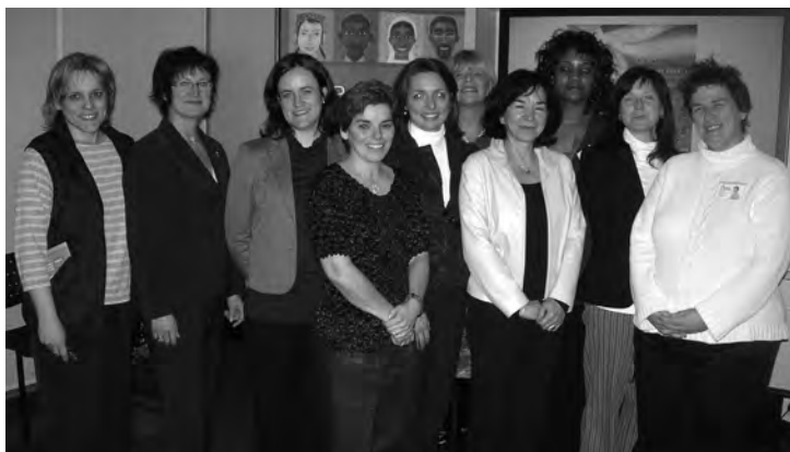
Une première réussie pour les 5 à 7 destinés aux femmes d'affaires !

Dans une perspective de complémentarité avec le programme du commerce équitable, l'équipe de l'éducation a également créé une formation à l'intention des serveurs du CAFÉ Nagua afin de les initier aux principes du commerce équitable et aux valeurs de l'organisation.