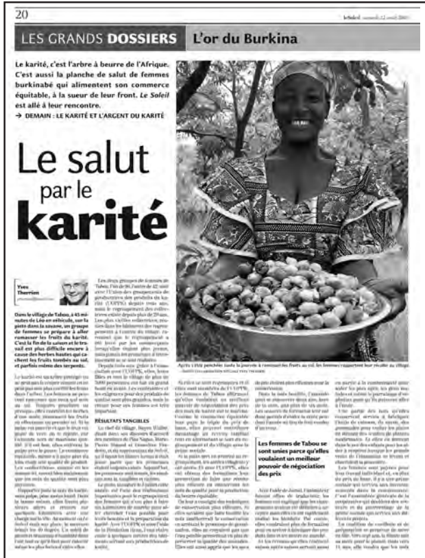
Journal Le Soleil 22 août: Une des six pleines pages parues dans journal Le Soleil sur le beurre de karité équitable à la suite du séjour au Burkina Faso du journaliste Yves Therrien avec l'équipe de l'éducation.