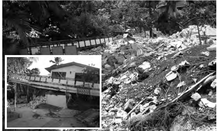
Le bureau de notre partenaire ICKL quelques jours après le séisme. Quelques semaines plus tard, il ne reste que des débris, la structure s'étant effondrée à la suite de nombreuses répliques de forte magnitude.

En République dominicaine, nous devons mentionner le Movimiento Socio-Cultural para los Trabajadores Haitianos (MOSCTHA) qui fut d'une grande aide pour secourir les Haïtiens à la suite du séisme. La Fundación Acción Comunitaria Máximo Gómez (FACMG), le Centro Dominicano de Desarrollo (CDD), le Centro de Investigación y Educación Popular (CIEPO), la Federación de Caficultores de la Región Sur (FEDECARES) et le Centro de Investigación y Mejoramiento de la Producción Animal (CIMPA) sont tous des partenaires de longue date, professionnels et engagés dans leur communauté. Ces organisations offrent des services de santé communautaire, de micro-crédit, d'éducation ou de conscientisation aux droits de la personne et de participation à la communauté.