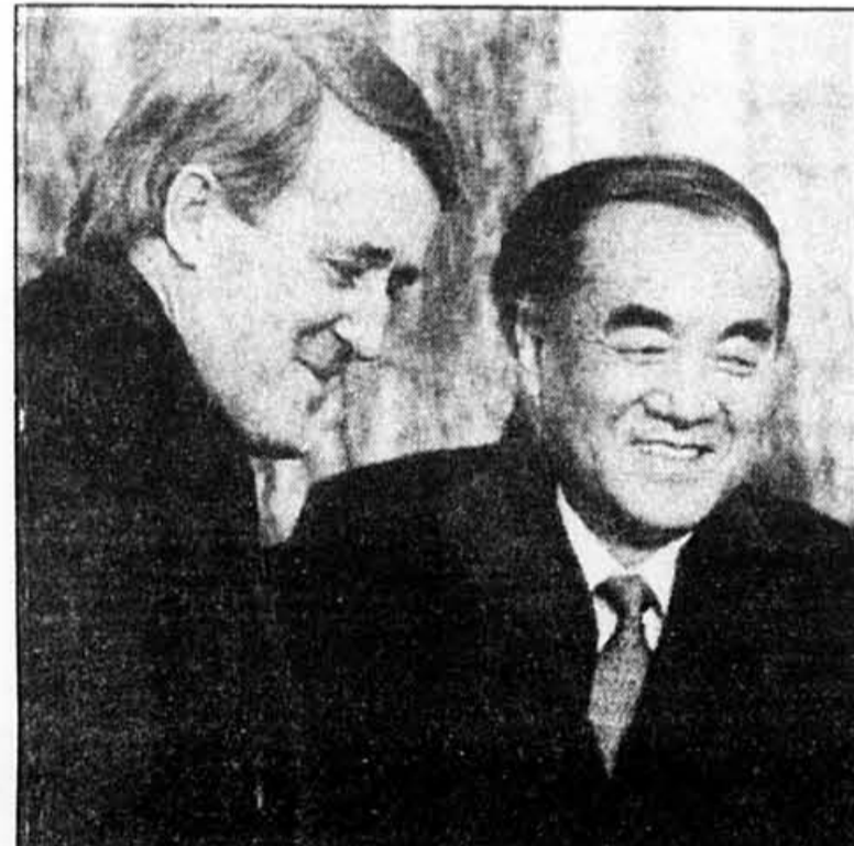
Le premier ministre japonais, M. Yasuhiro Nakasone, a eu hier un dernier tête-à-tête avec son homologue canadien, M. Brian Mulroney.