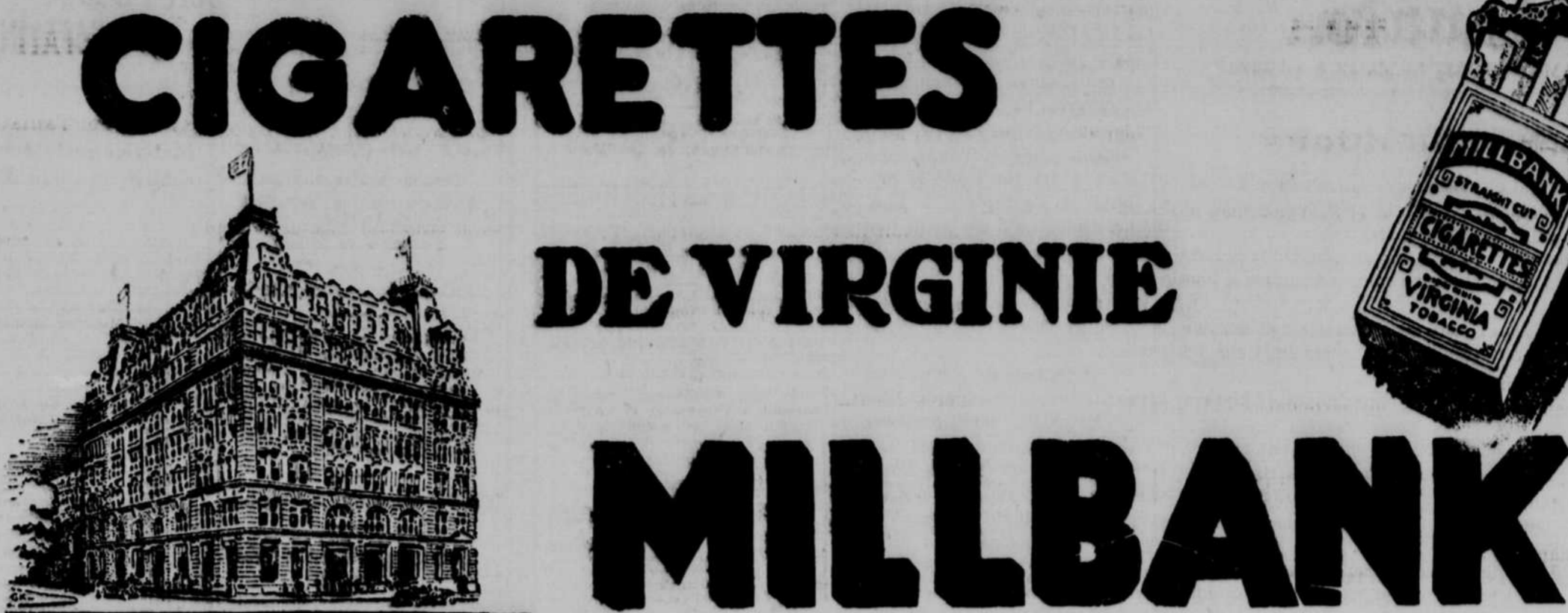
7 MILLBANK, LONDON, ENGLAND