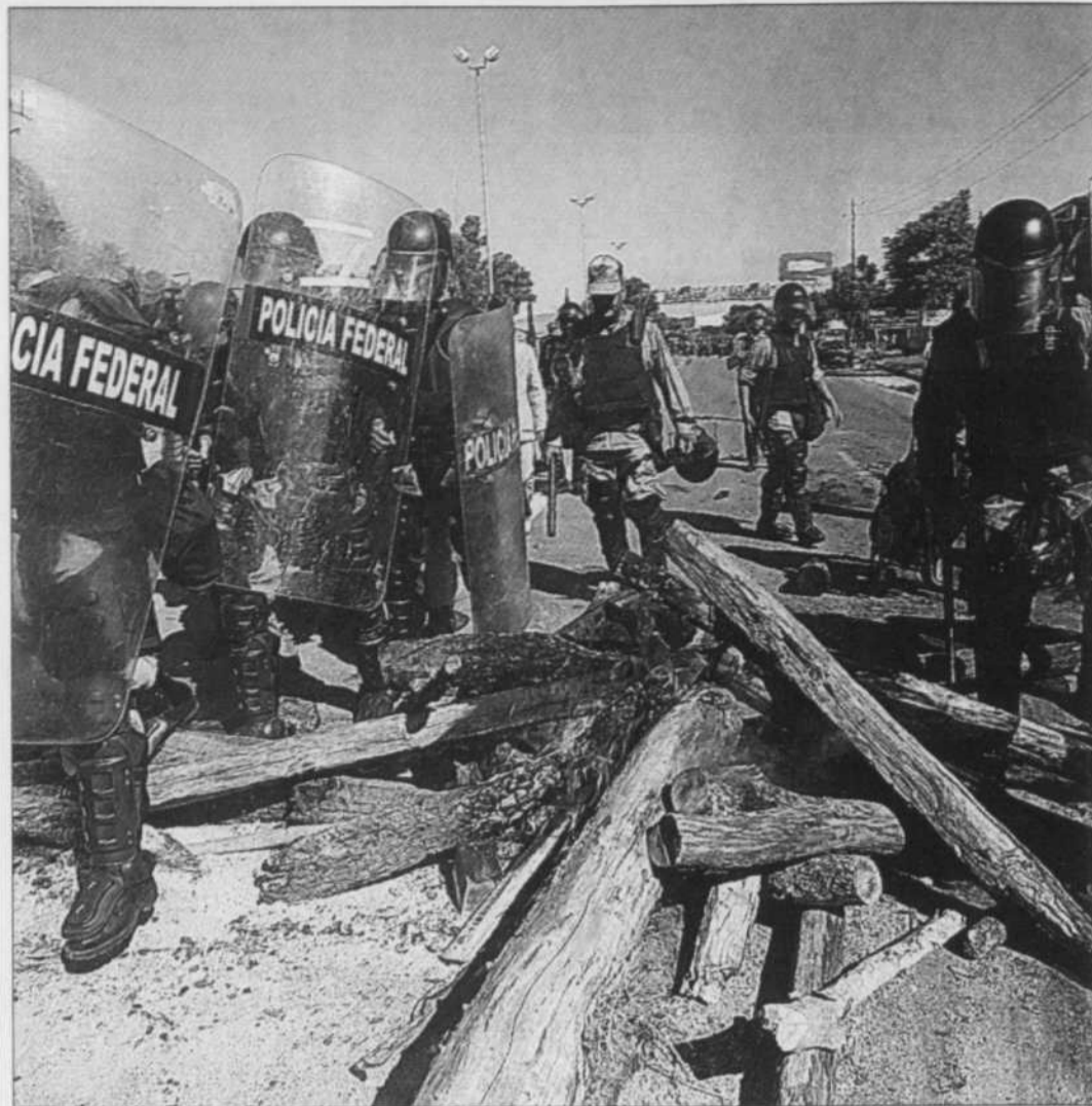
Forces policières entrant hier à Oaxaca, dans le sud du Mexique

Genève — Les pourparlers entre le gouvernement du Sri Lanka et les rebelles tamouls ont échoué hier à Genève sans que les protagonistes puissent même convenir d'une date pour la reprise des discussions, a annoncé le médiateur norvégien Erik Solheim. «Aucun accord n'a été obtenu sur les questions humanitaires ou sur une prochaine date pour des discussions», a déclaré M. Solheim, ministre norvégien du Développement international, lors d'une conférence de presse à l'issue de deux journées de difficiles tractations. Les belligérants se sont contentés de réaffirmer leur attachement à une trêve conclue en 2002, mais qui n'a pas empêché la violence de redoubler d'intensité ces derniers mois. «Les deux parties ont réitéré leur attachement à l'accord de cessez-le-feu et promis de ne pas lancer d'offensives militaires», a indiqué M. Solheim, tout en rappelant le désir des grandes puissances d'obtenir une accalmie sur le terrain. Depuis le dernier face-à-face fin février près de Genève, près de 3000 personnes ont perdu la vie dans le conflit, alors que les protagonistes s'étaient pourtant engagés à freiner la violence. Les médiateurs espéraient cependant que les deux parties acceptent au moins de poursuivre la discussion et conviennent d'une date pour se revoir en décembre ou janvier prochains. Les Tigres se battent pour l'autonomie du nord-est du Sri Lanka. Depuis le début de leur insurrection en 1972, au moins 60 000 civils et militaires ont été tués dans ce conflit. — AFP