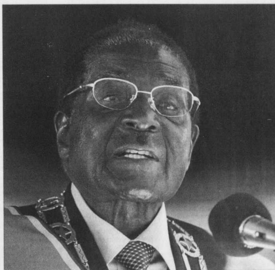
Robert Mugabe, président du Zimbabwe