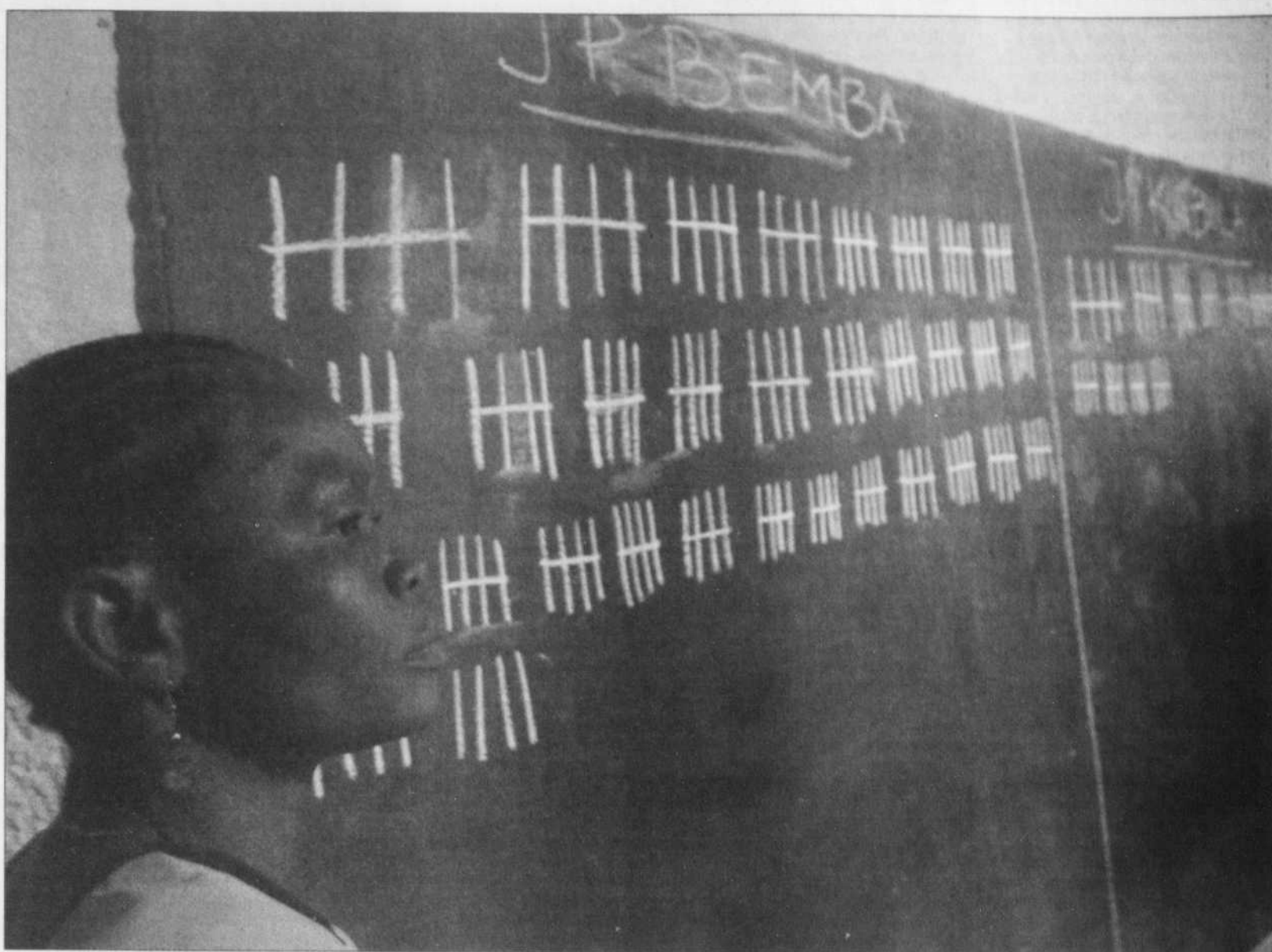
Dans un bureau de scrutin à Kinshasa: un tableau avec le nombre d'électeurs ayant voté pour Bemba et Kabila, les deux principaux candidats.

François Brousseau est chroniqueur et affectateur responsable de l'information internationale à la radio de Radio-Canada. francobrousseau@hotmail.com