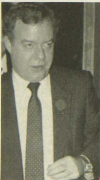
Robert René de Cotret