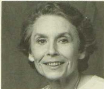
«Louise Maheux-Forcier». Lect. Françoise Faucher.