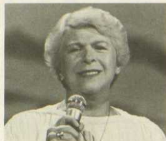
Clairette En accords

Radio FM Bertrand Roulet aux Grands Concerts