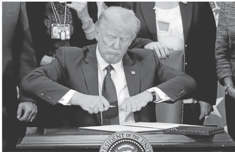
Donald Trump signe le décret autorisant la construction du mur.

Mais le ministre de l'Économie Ildefonso Guajardo a clairement averti qu'il y avait « des lignes rouges » à ne pas franchir.