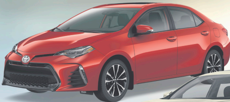
COROLLA CE 2017

41$ 0$ D'ACOMPTE /SEMAINE* EN LOCATION 60 MOIS