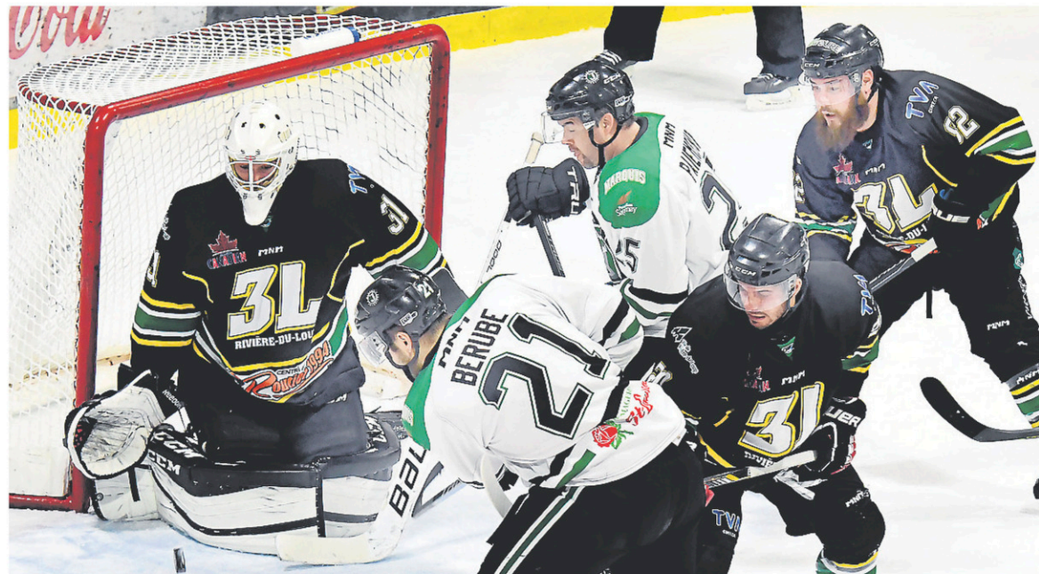
De l'action tirée d'un match récent de la Ligue nord-américaine opposant les 3L de Rivière-du-Loup aux Marquis de Jonquière, à Saguenay.