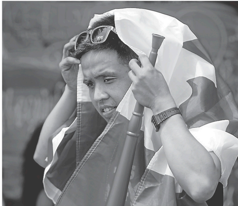
Le poids démographique de la population de langue maternelle française au Québec devrait chuter de 79 % en 2011 à une proportion oscillant entre 69 et 72 % en 2036, selon Statistique Canada.

Les auteurs de l'étude font toutefois valoir que la population dont la langue d'usage est le français — c'est-à-dire la langue qui est parlée à la maison, même si ce n'est pas la langue maternelle — connaîtra une hausse.