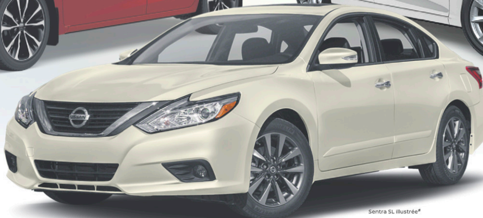
SENTRA SV 2017

49$ 0$ D'ACOMPTE /SEMAINE* EN LOCATION 60 MOIS