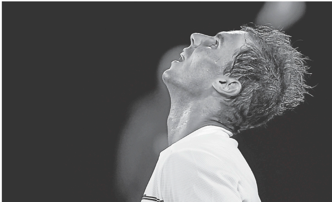
L'Espagnol Rafael Nadal, 30 ans, se mesurera au Bulgare Grigor Dimitrov en demi-finale des Internationaux d'Australie.

Il s'agit d'un septième gain en neuf duels face à Raonic pour Nadal, qui a signé un 50 e gain à