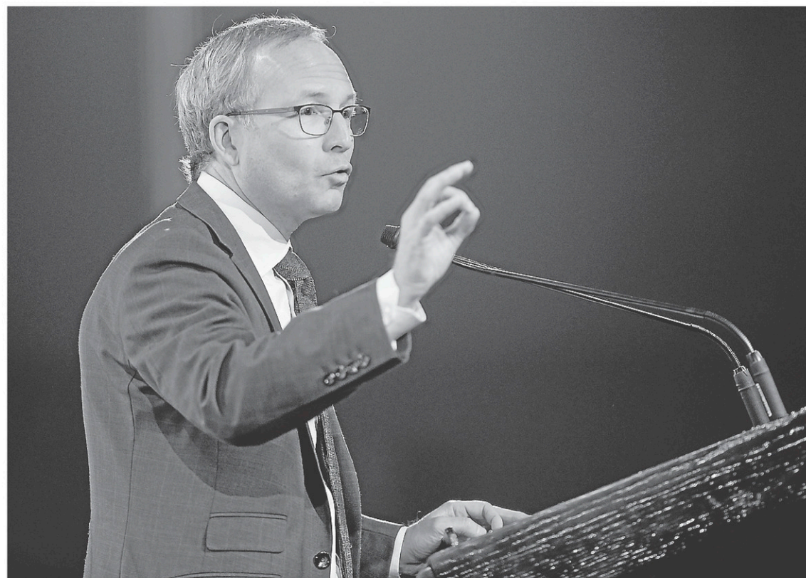
Cette enveloppe de 100 millions $ par année, c'est du « net », c'est de l'argent qui n'existait pas, dit l'ex-président du Conseil du trésor, Martin Coiteux.

D'ici la fin de l'année, le gouvernement fera connaître sa nouvelle « stratégie d'occupation du territoire ». « Elle pourra faire état, région par région, des priorités d'intervention que chacune d'entre elles souhaiterait voir mettre de l'avant », résume un document de consultation.