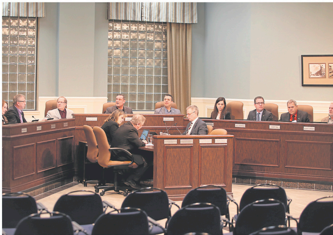
La composition du comité de pilotage mis en place pour l'élaboration d'une politique Égalité a récemment été entérinée par les élus de Granby.