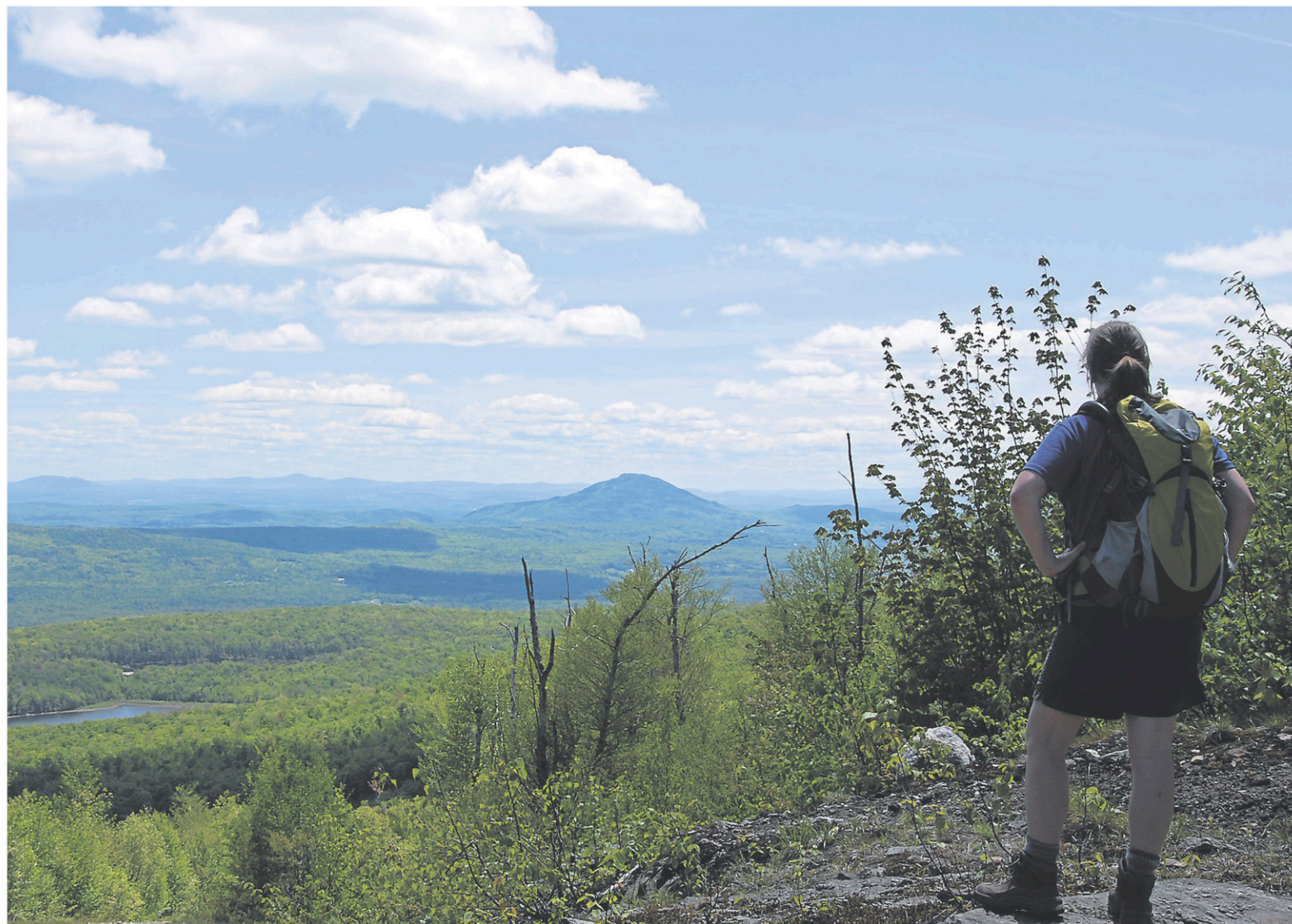
Des compensations financières doivent être versées aux municipalités qui accueillent sur leur territoire des aires protégées, comme les montagnes Vertes dans le canton de Potton, soutiennent les MRC de Brome-Missisquoi et Memphrémagog.

La survie de certains groupes est en jeu, soutient M me Lelièvre. « On n'a pas d'argent. On galère pour survivre. On fait ça pour l'ensemble de la population, pour protéger des forêts et des