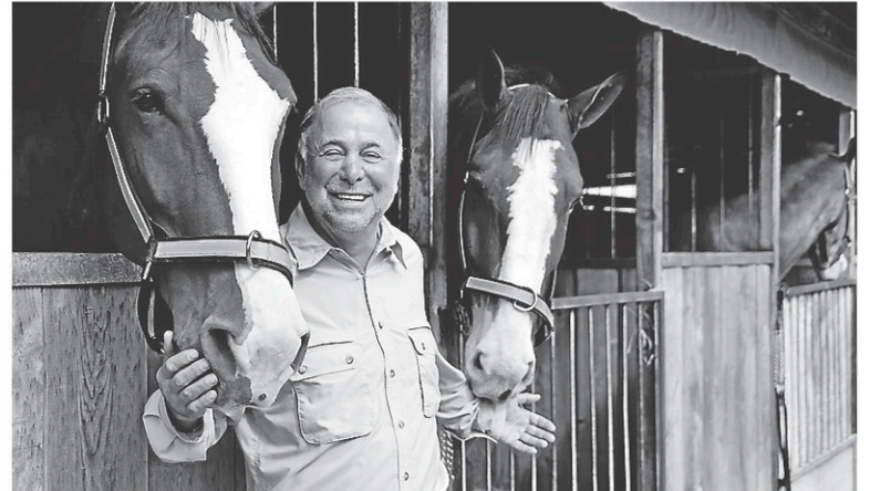
Le député de Brome-Missisquoi et ministre de l'Agriculture, Pierre Paradis, est depuis longtemps un fervent amateur d'équitation.

Denis Paradis ne se trouvait pas avec son frère cette semaine au moment de l'accident. «Habituellement, il fait ça — de l'équitation