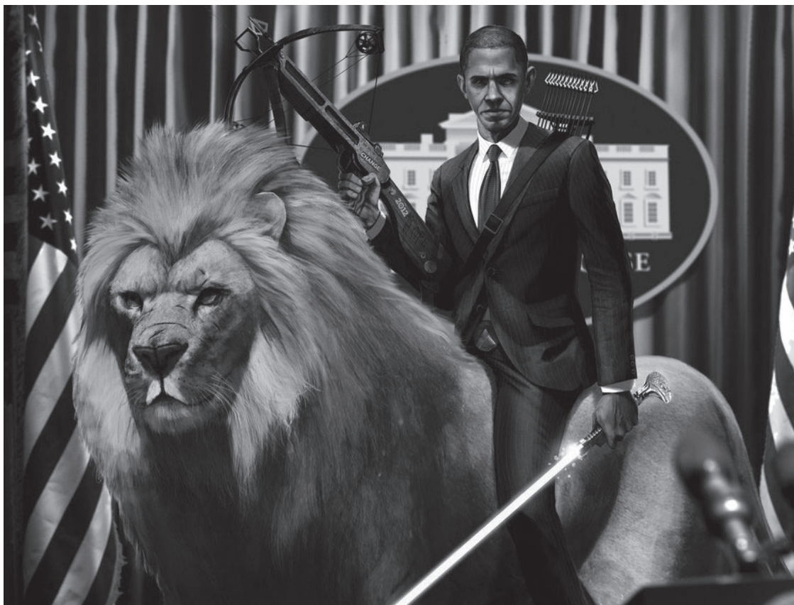
Parce que notre couverture n'était pas suffisante...

On verra bien ce qu'Obama pourra faire, considérant qu'il n'a toujours pas le contrôle de la chambre des représentants. Je n'ai pas hâte de voir à quel genre de compromis il devra consentir pour sortir le pays de l'impasse politique qui sévit en ce moment. On s'en reparle en janvier !