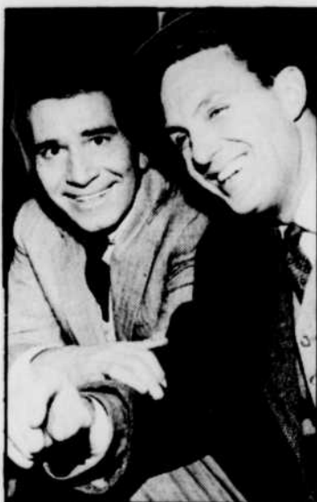
On peut voir «Les Incorruptibles», tous les jeudis à 23 h 30.