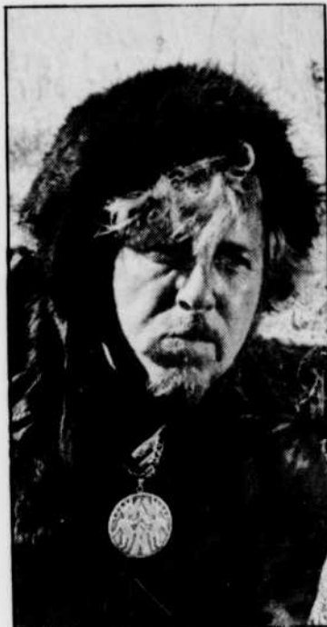
TEX, en Délard Désormais.