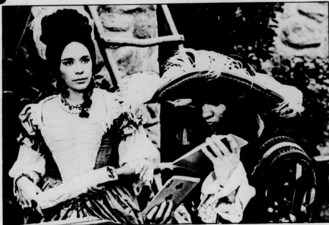
Louise FORESTIER et Robert CHARLEBOIS, en Crème Chantilly et en Frontenac.