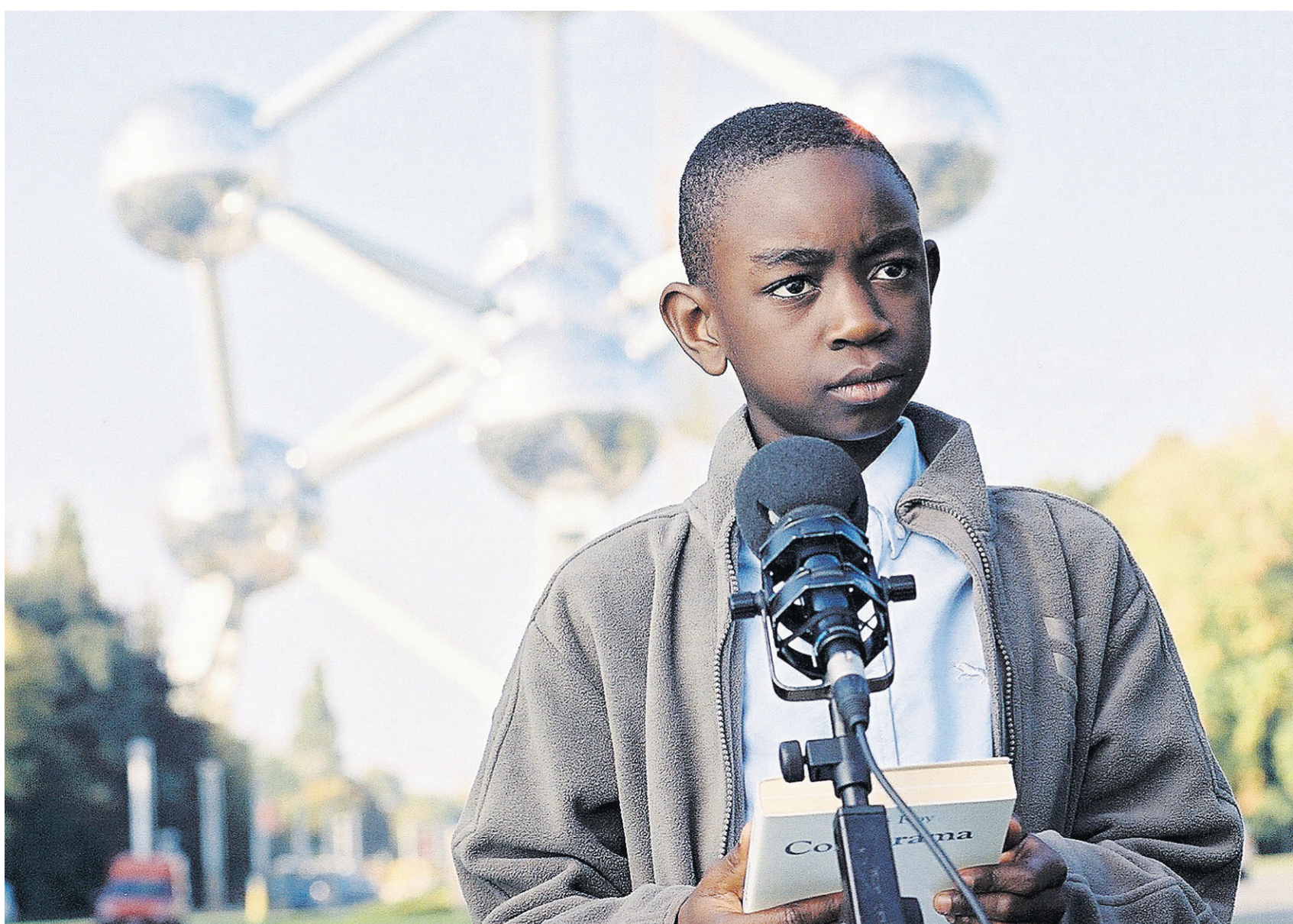
Congorama a suscité de l'intérêt lors des deux projections organisées pendant le Marché du film, au début de la semaine. Il sera projeté demain à la clôture de la Quinzaine des réalisateurs.