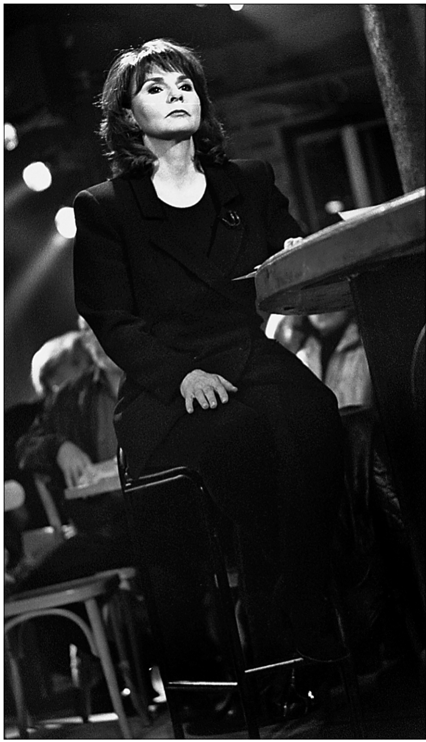
Christiane Charette en direct, au bar Chez Roger, la dernière émission animée par Christiane Charette.