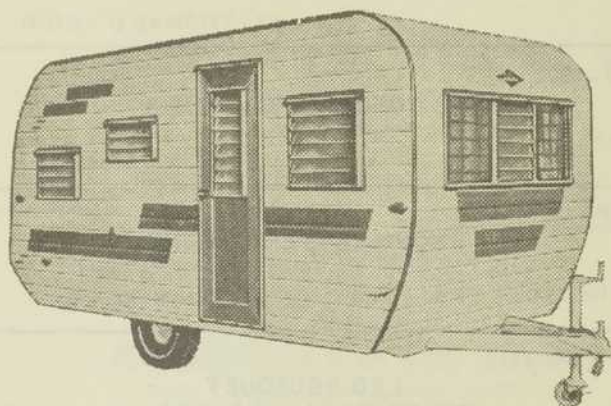
Citation... fabriquée par Century