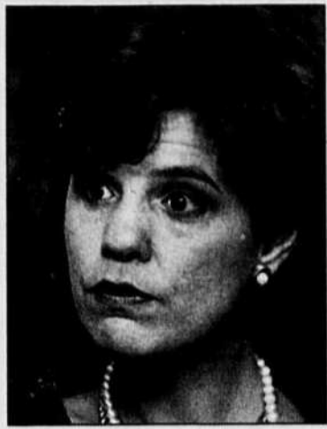
La ministre Liza Frulla-Hébert

Le siège social du conseil sera à Québec, où se dérouleront «principalement ses activités», précise le projet de loi 53. Mme Hébert «prévoit» que le conseil ouvrira un bureau à Montréal pour tenir compte de l'activité culturelle qui s'y déroule. Son budget sera de 42 millions