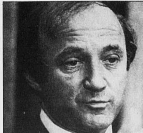
Le ministre André Bourbeau

Dans un avis transmis au ministère de la Main-d'œuvre et de la Sécurité du revenu le 29 octobre, la Commission admet le pouvoir du ministre de vérifier l'admissibilité de ceux qui demandent l'aide sociale. Mais déplore que la vérification puisse être faite