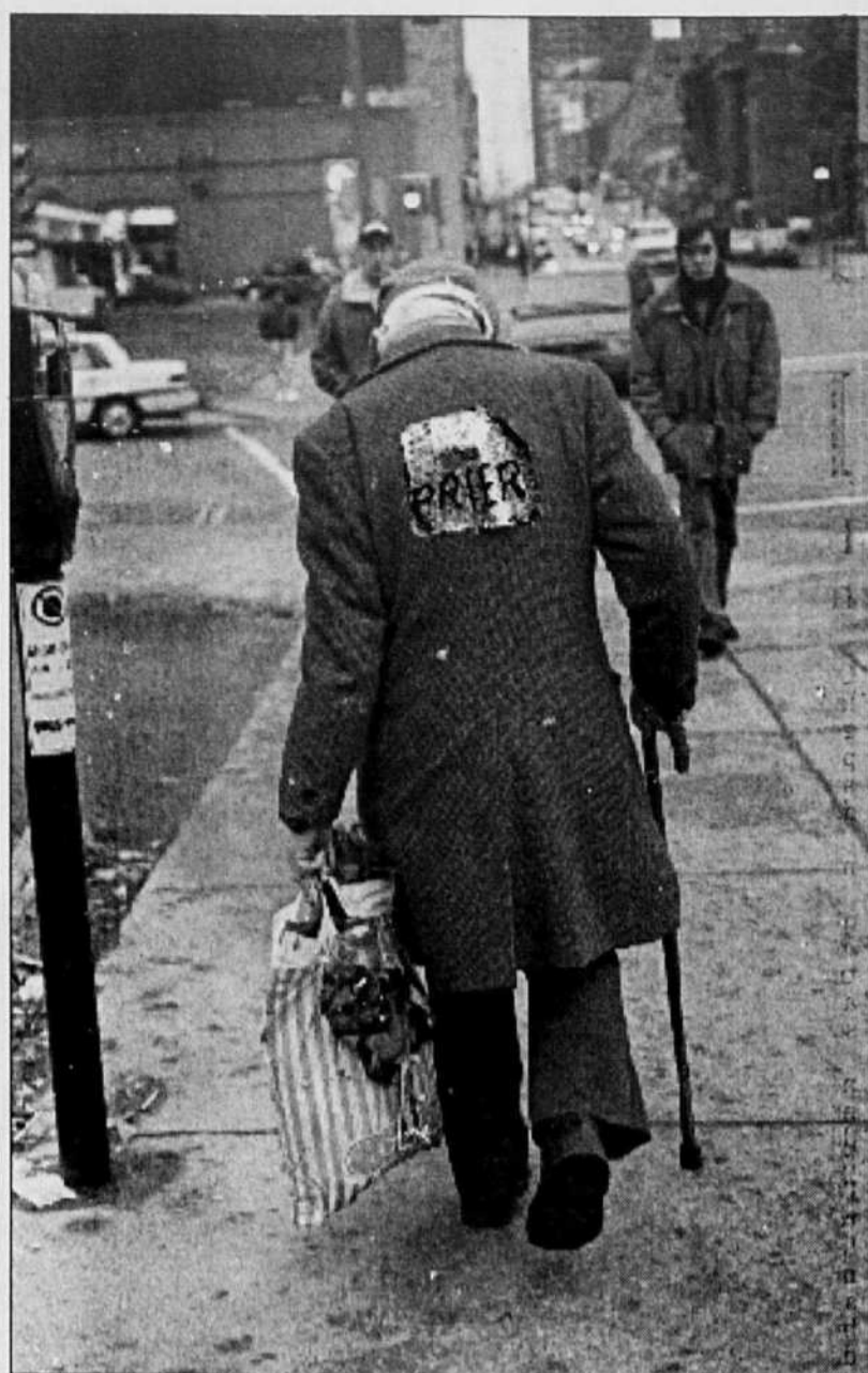
Croqué rue de Bleury par le photographe du DEVOIR, cet original a trouvé un moyen économique de faire passer son message.