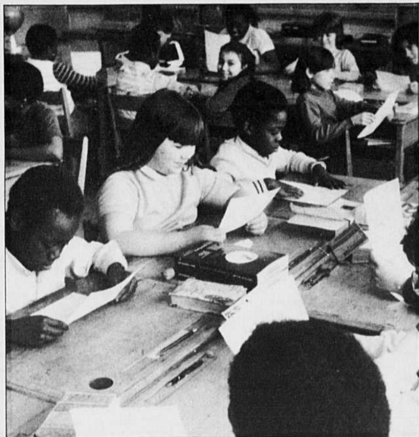
En vivant ensemble, les jeunes Blancs et les jeunes Noirs des écoles primaires apprennent à dépasser les perceptions et les préjugés, parfois négatifs, qu'ils ont des uns et des autres.