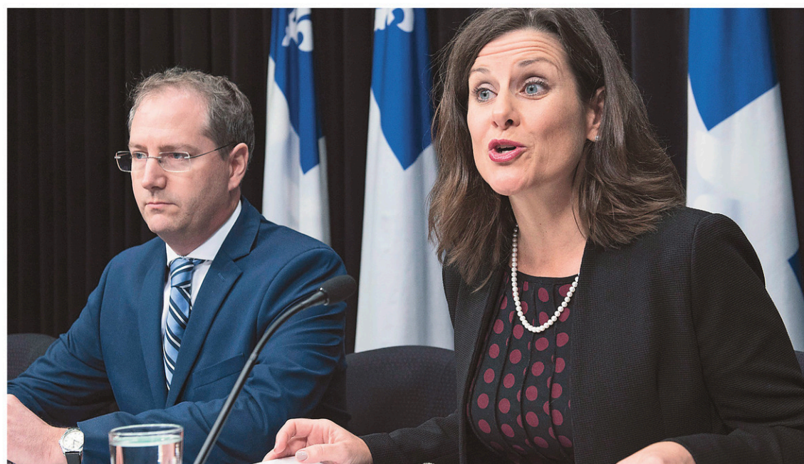
La ministre québécoise de la Justice, Stéphanie Vallée, expliquait mardi les principes d'application de la Loi sur la neutralité religieuse de l'État.