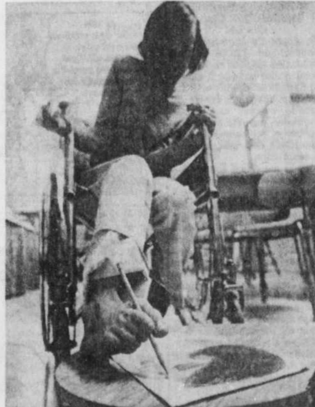
Un des exposants donne une démonstration de son savoir faire.

L'exposition, tenue mardi et mercredi, était le résultat de toute une année de travail. Une soixantaine de pièces étaient présentées, dont des tapis faits au poinçon, des sacs à main tissés, des dessins, des collages et divers autres objets en bois.