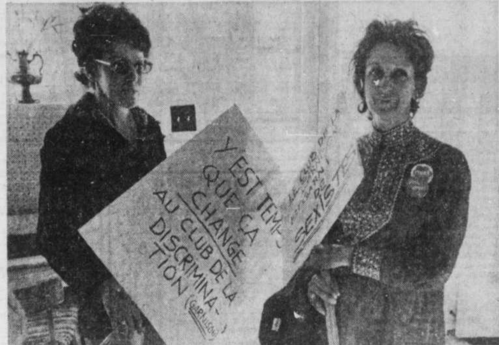
Deux manifestantes, pancarte à la main qui protestaient contre les membres du Club de la garnison de Québec qui refusent l'accès de leur cénacle aux femmes.

En plus de posséder une entrée pour les hommes, et une entrée pour les femmes, le Club de la Garnison possède également une salle à manger pour les hommes et une salle à manger mixte.