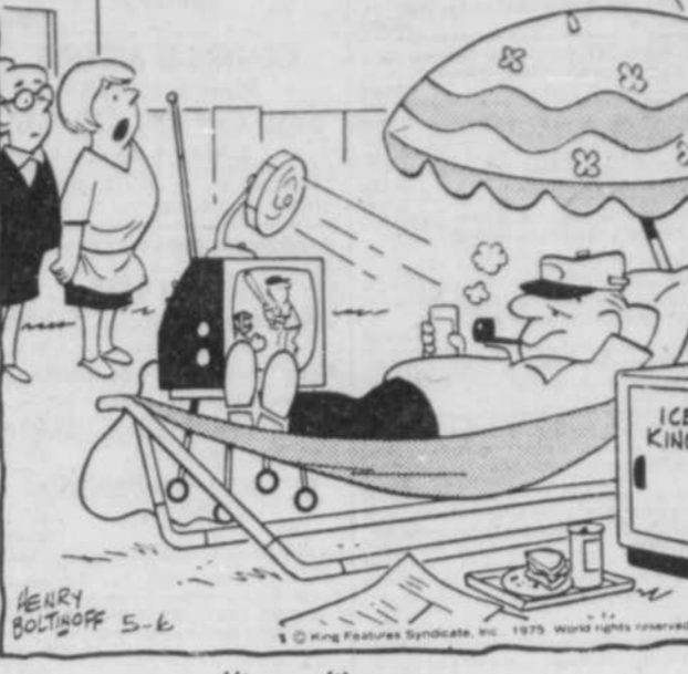
"Lorsqu'il pousse, il ne regarde pas la dépense!"

564 TERRAINS A VENDRE... RUE DE LA POTERIE... CHATEAU-RICHER