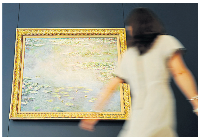
Nymphéas, de Claude Monet