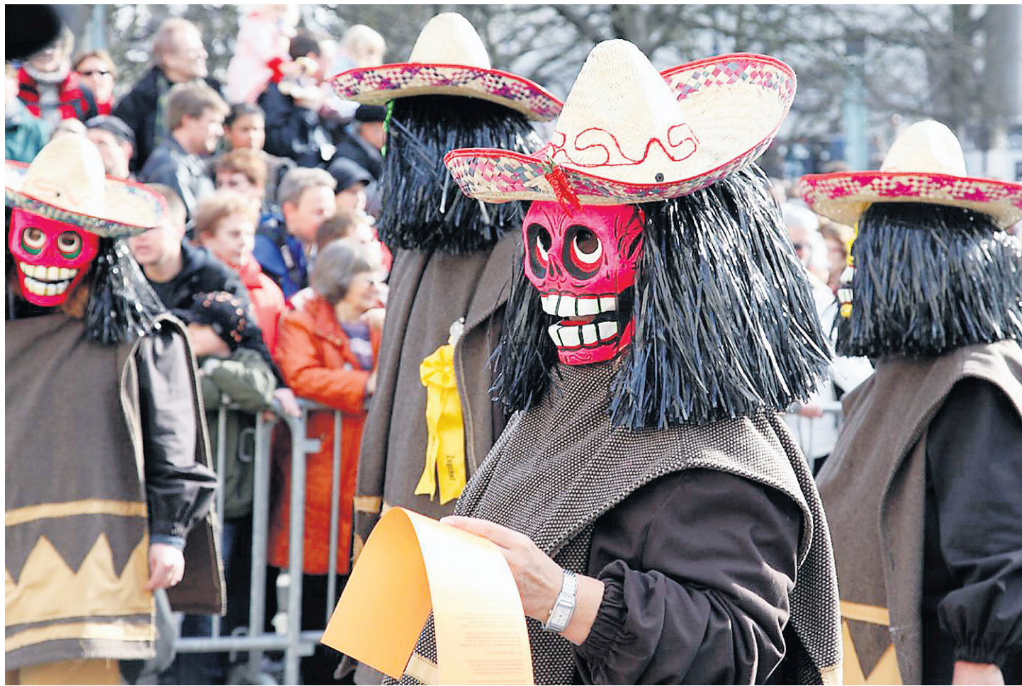
Le Carnaval de Bâle, un des plus vieux du monde, se transportera (en partie) à Montréal le 18 juillet.