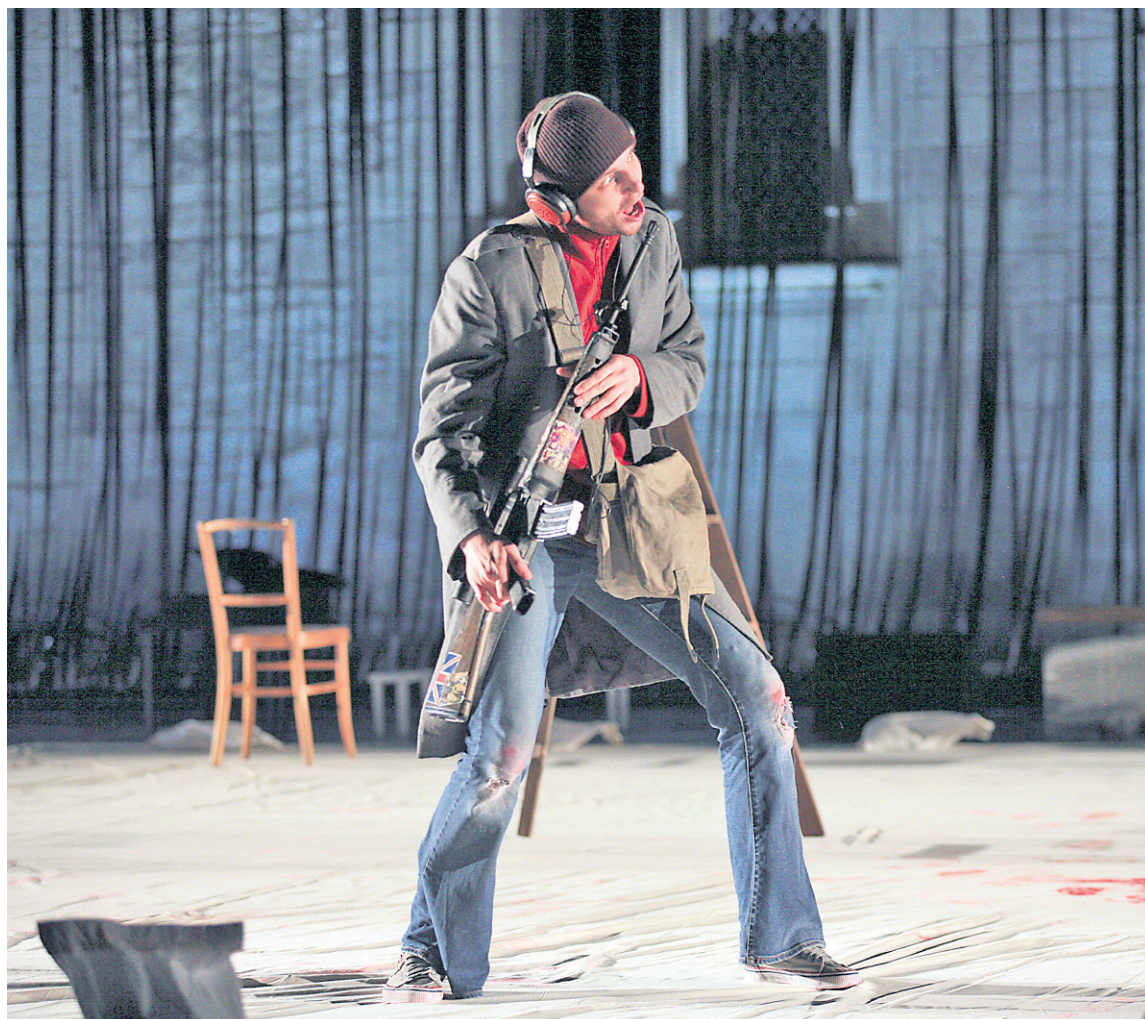
Incendies est la plus dure et la plus percutante des trois pièces.

Fresque sur l'identité et la mémoire, sur les liens familiaux qui relient ou condamnent, Le sang des promesses confronte à la guerre et rappelle combien précieuse est la paix, insiste sur l'importance de connaître son histoire pour trouver sa place dans l'Histoire. Et de cette grande noirceur, oui, jaillit enfin un peu de lumière. Ou plutôt une promesse, celle de ne jamais oublier afin de plus faire couler le sang.