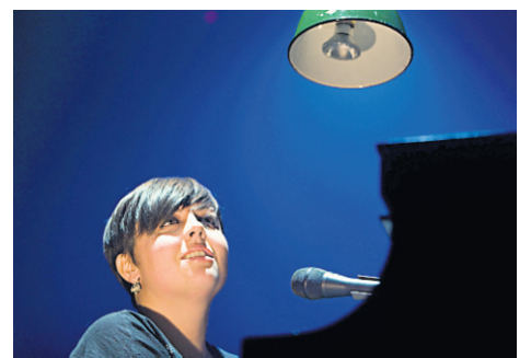
Ariane Moffatt