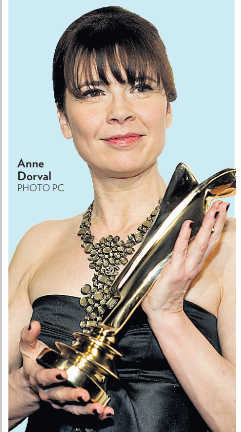
Anne Dorval