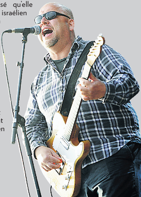
Frank Black du groupe Pixies