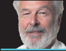
NELSON DUMAIS COLLABORATION SPÉCIALE

SAN FRANCISCO — La version 4 de l'iPhone, redoutable canon de l'empire Apple dont la presse spécialisée avait néanmoins éventé le secret en mars et avril derniers, a été lancée hier en matinée par le PDG d'Apple, Steve Jobs. Comme c'est maintenant la tradition, ce fut fait lors de la présentation d'ouverture du WWDC 2010, la rencontre annuelle des créateurs de logiciels Apple.