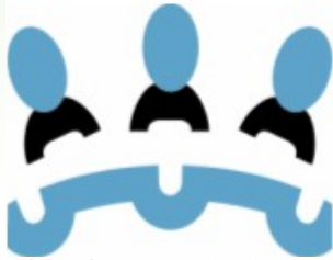
Table de concertation en employabilité d'Acton et des Maskoutains

Saviez-vous qu'il y a déjà un an, une nouvelle Table de concertation était créée à Saint-Hyacinthe pour dynamiser le développement de l'employabilité dans les MRC d'Acton et des Maskoutains? Toujours active, cette table est composée d'intervenants du milieu tels que les organisations d'employabilité, les établissements de formation, les Centres locaux de développement, etc. Cette table a pour objectif de :