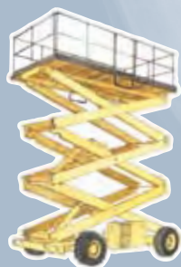
de la plate-forme élévatrice