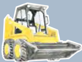
de la mini-chargeuse