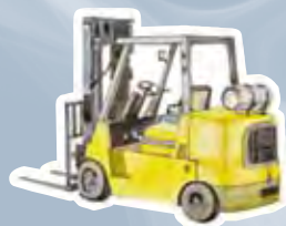
du chariot élévateur