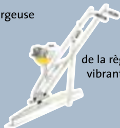
de la règle vibrante