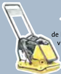
de la plaque vibrante