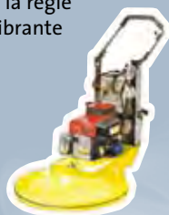
de la polisseuse à plancher