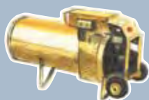
de la chaufferette (salamandre)