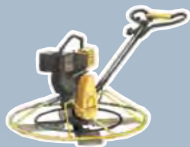
de l'aplanisseuse de béton (hélicoptère)

Les véhicules, les appareils et les outils munis d'un moteur à combustion (propane, essence, carburant diesel) produisent du CO. Il peut s'agir :