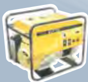
de la génératrice