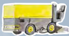
de la surfaceuse à glace