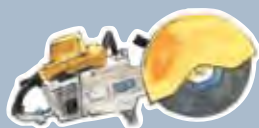
de la scie à béton