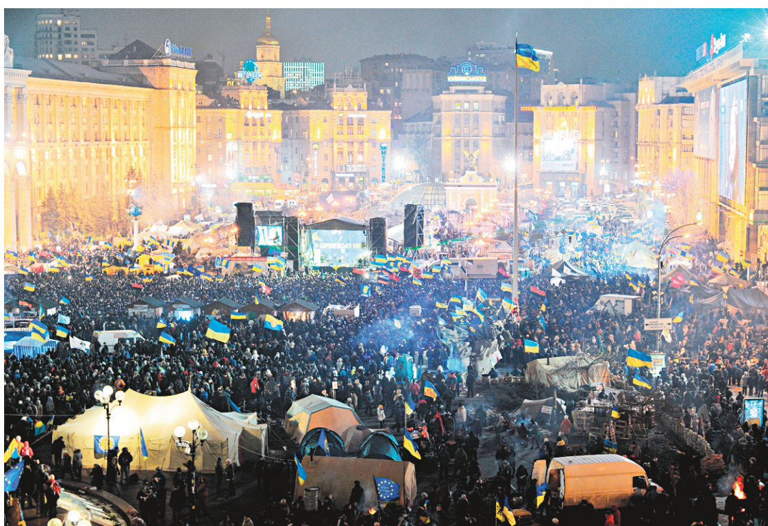
L'opposition ukrainienne a rassemblé 50 000 personnes mardi à Kiev.

M. Poutine a aussi indiqué que la Russie avait accepté de réduire d'un tiers le prix du gaz qu'elle exporte en Ukraine, qui coûtera désormais 268,5 dollars les 1000 mètres cubes contre plus de 400 actuellement.