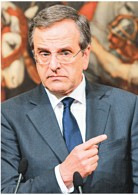
Le premier ministre grec, Antonis Samaras

La Banque de Grèce est à peine moins optimiste que le gouvernement