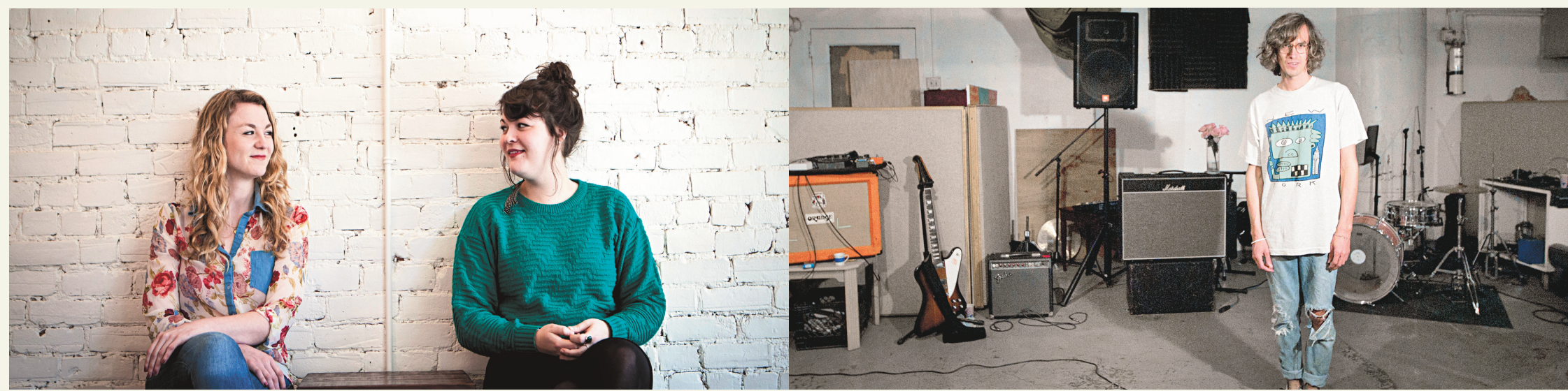
Au sommet de nos palmarès des dix meilleurs disques québécois de l'année trônent Le poids des confettis des sœurs Boulay et Maladie d'amour de Jimmy Hunt.