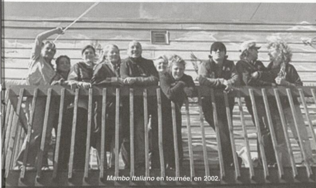
Mambo Italiano en tournée, en 2002.

Compagnie n'aurait pensé pouvoir concilier les horaires de tous les comédiens - une distribution de rêve - tous fort occupés chacun de leur côté et pourtant... ce sont les comédiens eux-mêmes qui ont fait état de leur désir d'effectuer cette tournée de 45 représentations à travers le Québec. Mambo Italiano est un autre exemple d'une tournée non prévue, mais... le désir des comédiens conjugué à leur passion et au succès de la pièce... allez, on y va!