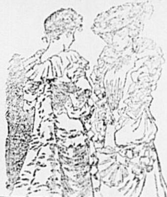
— Mais, si ce que vous dites est vrai, c'est une horreur que cette femme-là! — Vous pensez bien que moi, sa meilleure amie, je n'trai pas la calomnier.

surtout, très... oh! mais très hypocrite! qualités et défaut, n'est-ce pas? Ça te va-t'y, mon vieux??? Si oui que de graves et sérieuses épreuves t'auras à subir devant le haut tribunal de