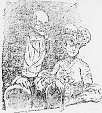
— Ce qui me plaît dans cette artiste, c'est le timbre de sa voix, et vous savez, je m'y connais en timbres. Je suis philatéliste!