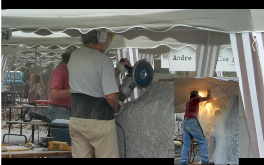
Le Symposium international de sculpture sur granit de Stanstead

Le Centre d'interprétation du granit de Stanstead vous invite à participer à sa 3e édition du Symposium international de sculpture de Stanstead, qui se tiendra du 29 août au 7 septembre sous le thème du «Cosmos». L'an dernier, le Symposium a accueilli près de 10 000 visiteurs et des artistes en provenance de l'Italie, d'Allemagne, de Belgique, des États-Unis et du Canada. Le Symposium de sculpture est un événement phare pour la région et son rayonnement est international.