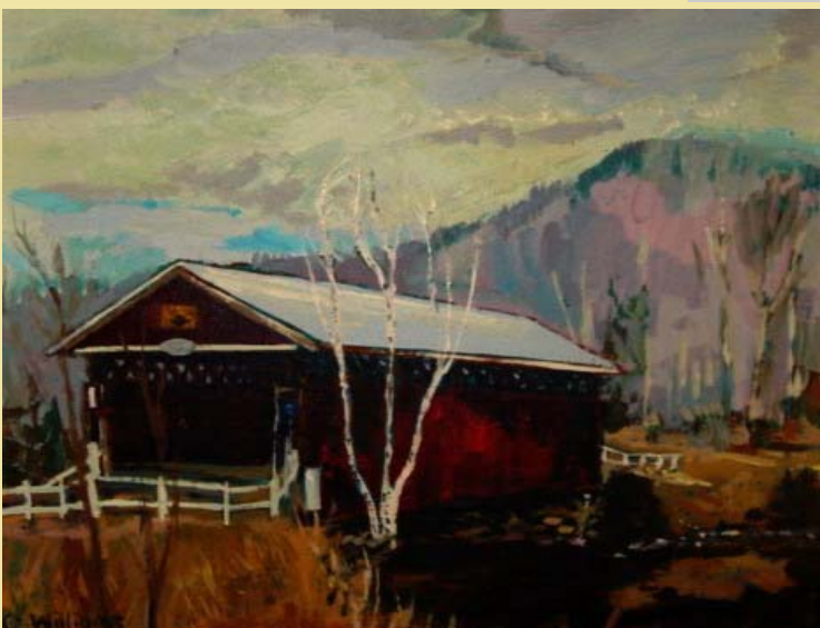
Pont à Fitch Bay