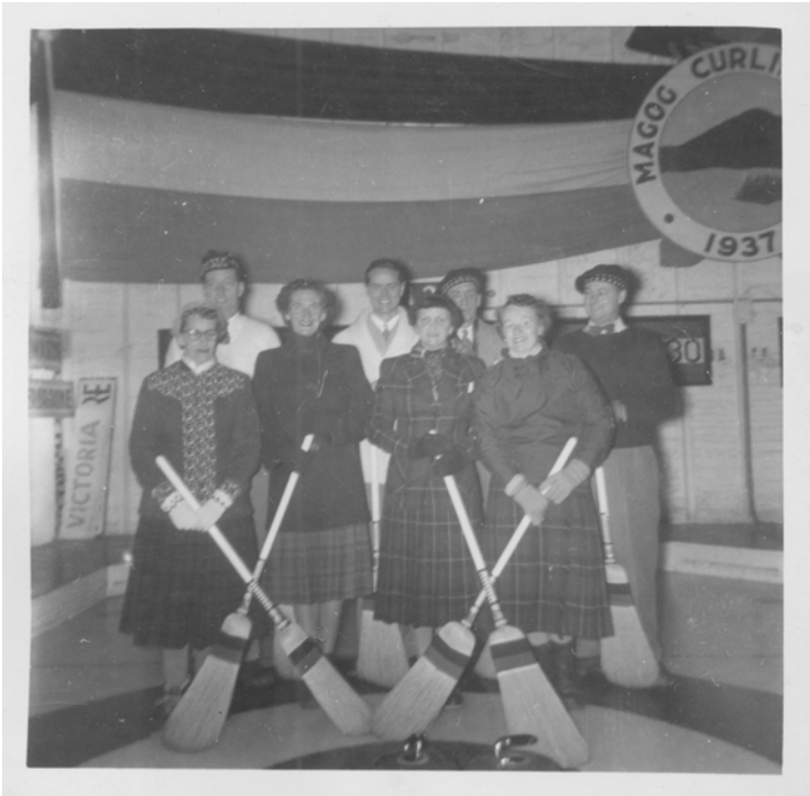
Club de Curling de Magog

Une exposition-vitrine présentée par la Société d'histoire de Magog du 31 mars au 1 er juin 2008, au 375, rue Principale Ouest à Magog.