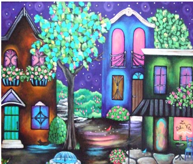
Susie Mouroukas, «Some enchanted evening »

Le Musée international d'art naïf de Magog a le plaisir de vous inviter à venir visiter sa toute nouvelle exposition intitulée « L'éveil de la nature », jusqu'au 6 juillet 2008.