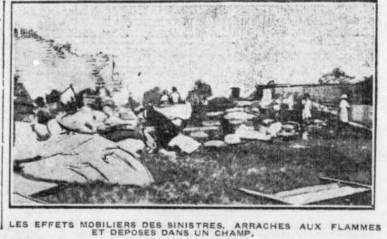
LES EFFETS MOBILIERS DES SINISTRES, ARRACHES AUX FLAMMES ET DEPOSES DANS UN CHAMP.

Une recensement demandant l'achat d'un appareil destiné à combattre les incendies, a été présentée au Conseil municipal.