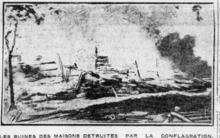
LES RUINES DES MAISONS DETRUITES PAR LA CONFLAGRATION, D'HIER, A YAMASKA OUEST.

trés et les matières postales ont été sauvées. Les dommages sont évalués à environ $60,000. Les assurances ne