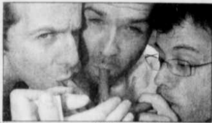
Le trio derrière «Horloge biologique»