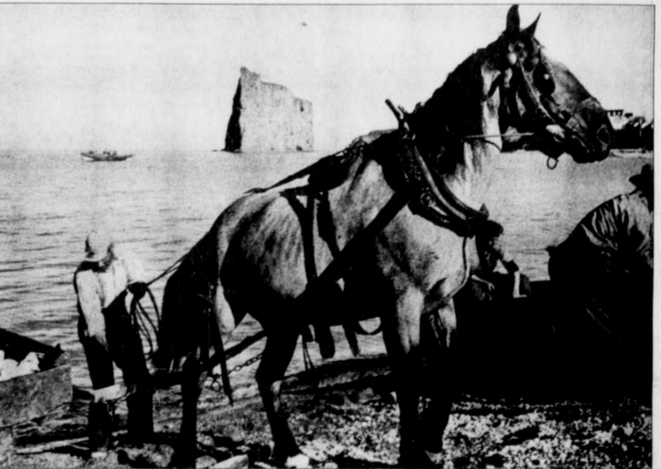
L'exposition est présentée en collaboration avec le département de photographie du Cégep de Matane. Les photos de Lida Moser sur la Gaspésie et sur le reste du Québec appartiennent aux Archives nationales du Québec.