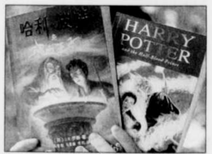
La version pirate du «Prince de sang-mêlé» ressemble aux Harry Potter officiels précédents publiés en Chine.

■ PÉKIN (AP) — Il y a quelques erreurs de traduction, mais la version chinoise pirate de Harry Potter et le Prince de sang-mêlé était déjà en vente hier au marché noir dans les ruelles de Pékin, deux mois et demi avant la date de sortie prévue pour la traduction officielle. Au prix imbattable de 20 yuans (3 $ CAN), les fans chinois impatients peuvent découvrir le sixième tome des aventures de l'apprenti sorcier, appelé phonétiquement Ha-li Bo-te en Chine. La version pirate du Prince de sang-mêlé ressemble aux cinq Harry Potter officiels précédents publiés en Chine par la maison d'édition Littérature populaire. Mais il manque plusieurs scènes d'action cruciales et il