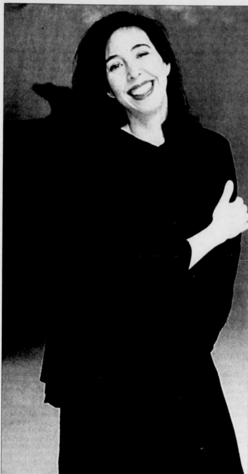
Avec élégance, entrain et souplesse, la pianiste Angela Hewitt a donné toute sa musique de mémoire, gracieuse et souverainement belle, ensorcelante même.