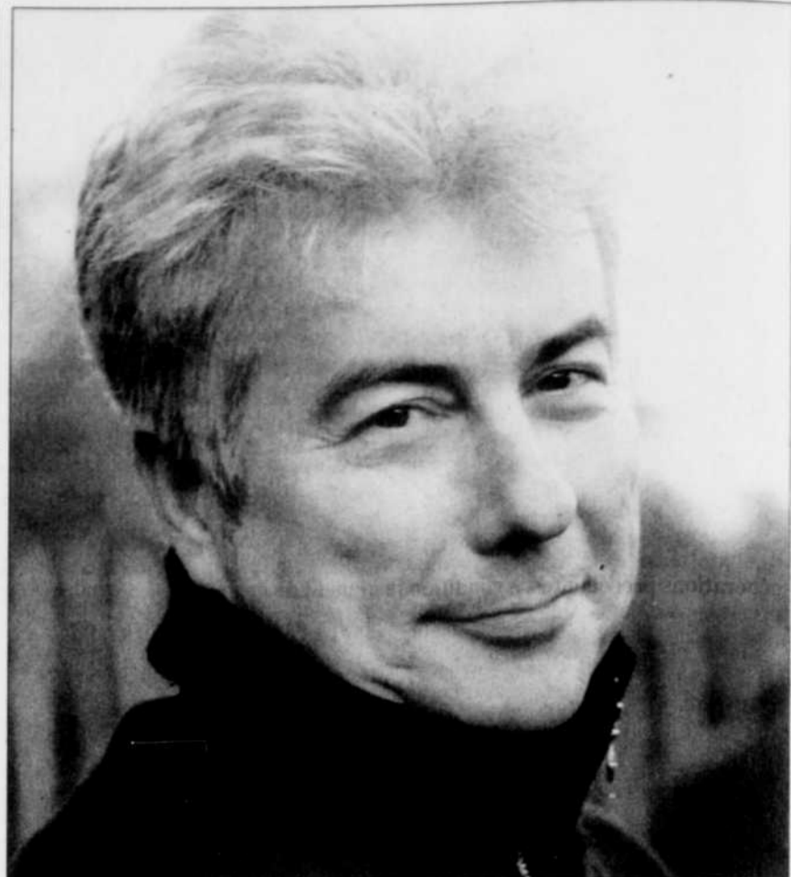
À 55 ans, Ken Follett appartient au cercle très fermé des millionnaires du suspense.

■ BEVERLY HILLS — Le sabre laser utilisé par Luke Skywalker, le héros de La Guerre des étoiles , a été cédé pour plus de 200 000 $US lors la vente aux enchères d'une série d'objets mythiques de Hollywood. Ce sabre laser — en réalité un tube de chrome avec une poignée de caoutchouc — brandi par l'acteur Mark Hamill dans le premier épisode de la saga en 1977 était l'objet, vedette d'un lot de 550 pièces dont la vente a rapporté plus de 2 millions $. AFP