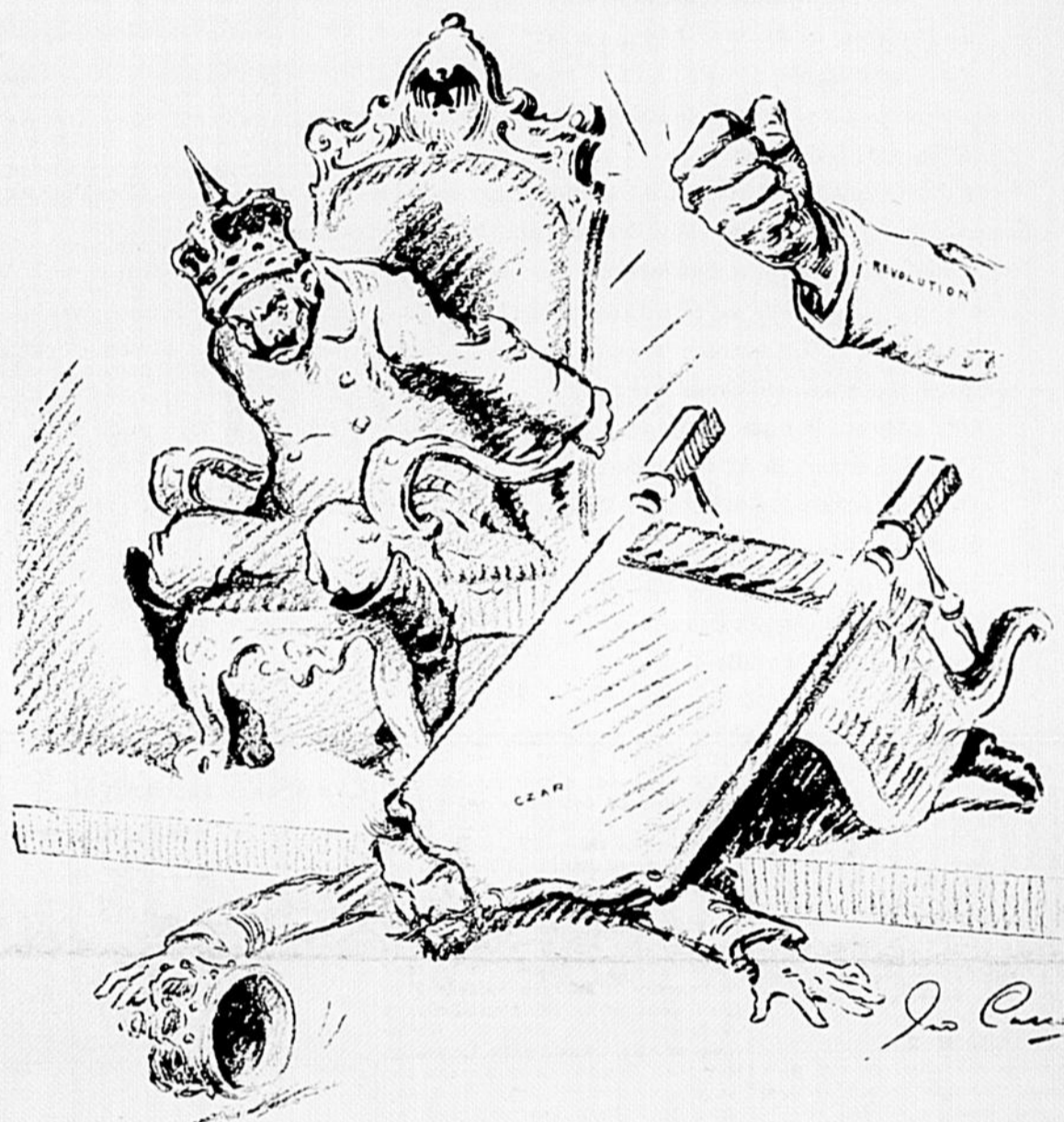
Si Médéric avait lu l'Histoire (mais il nous a confié qu'il garde son cerveau vierge de toute étude) il aurait vu comment débarquent les czars et débarqueront bientôt les kaisers.