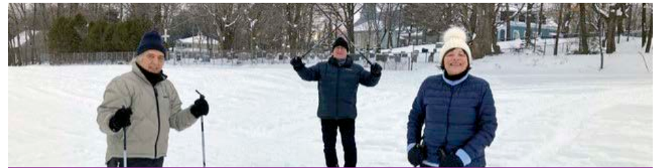
La bibliothèque La Ressource invite la population de Sainte-Pétronille à participer à une exposition des meilleures photos de votre vie active dans la municipalité.