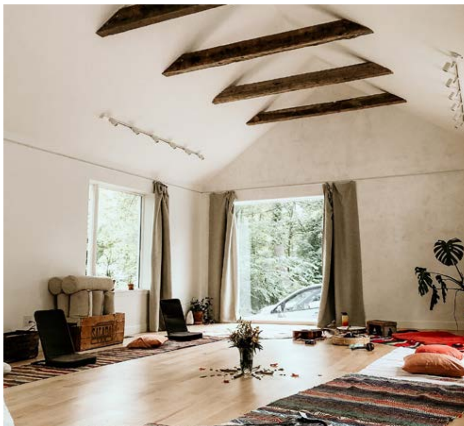
Le nouveau bâtiment écologique permet notamment la tenue d'activités de détente.