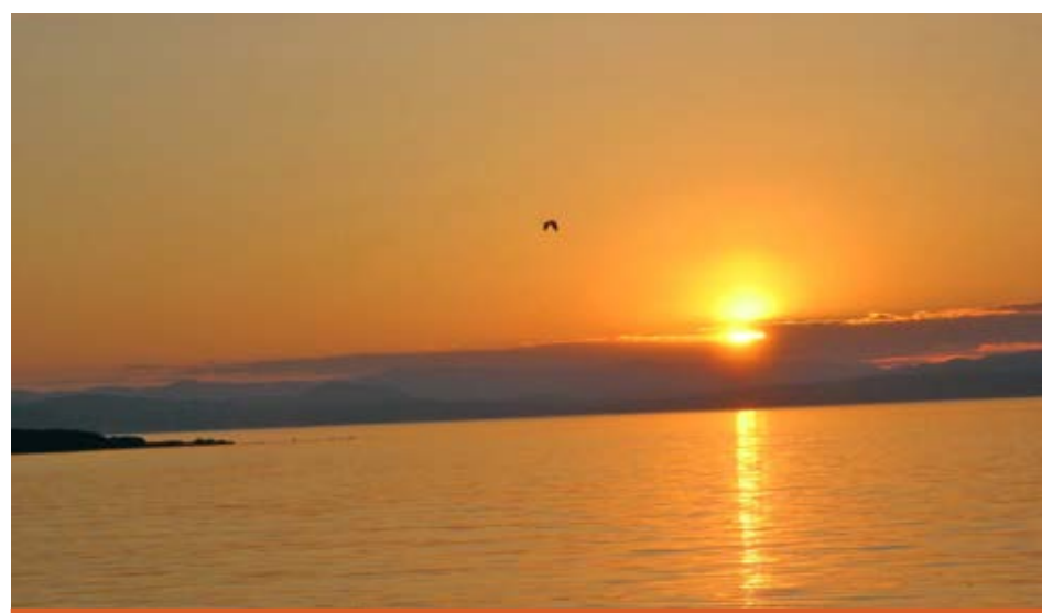
L'œuvre Réveries , de Jacqueline Guimont, sera exposée du 4 août au 7 septembre dans le centre d'interprétation.