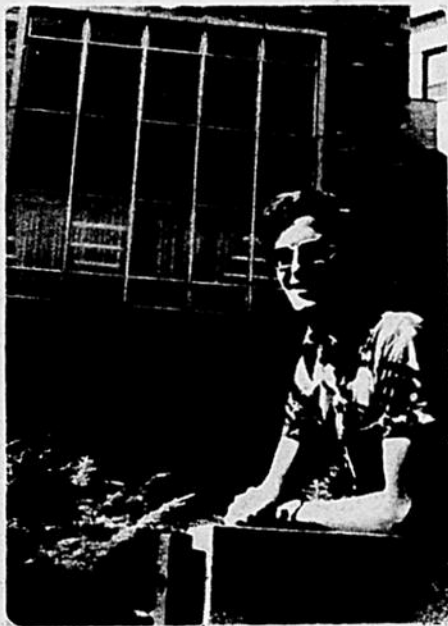
Richard Doyle Biologie

A toutes les deux semaines, à partir du 30 janvier, le Groupe de la Veillée organisera des soirées d'improvisation collective. Le Groupe de la Veillée est un atelier de recherches sur le travail de l'acteur. Ces soirées sont ouvertes à tous. Pour plus de renseignements, veuillez téléphoner à 522-2764 ou à 652-2349.