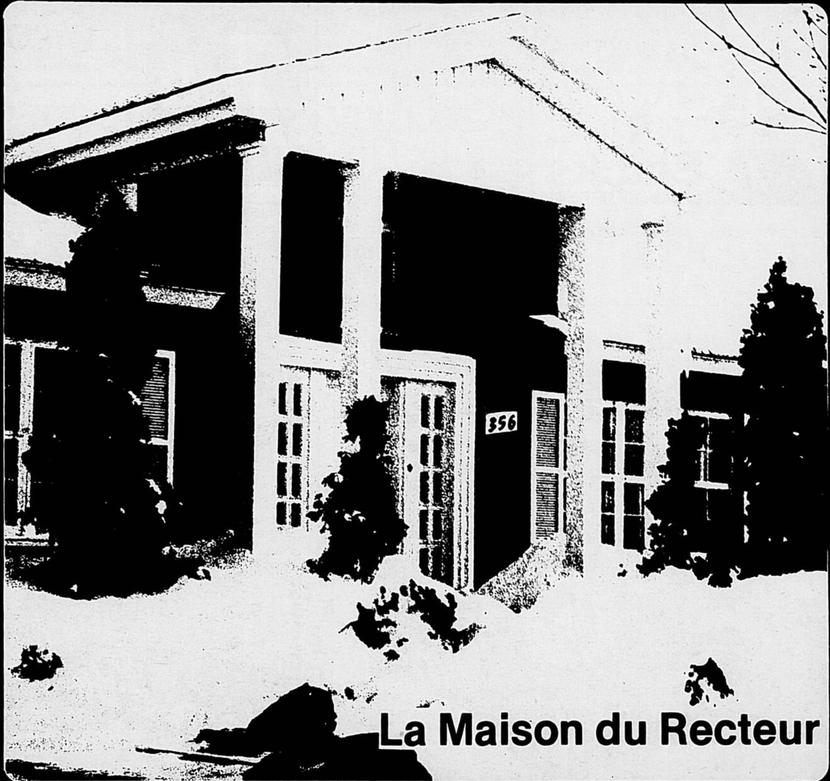
La Maison du Recteur

DU QUARTIER LATIN, 26 JANVIER 1976, NO. 17