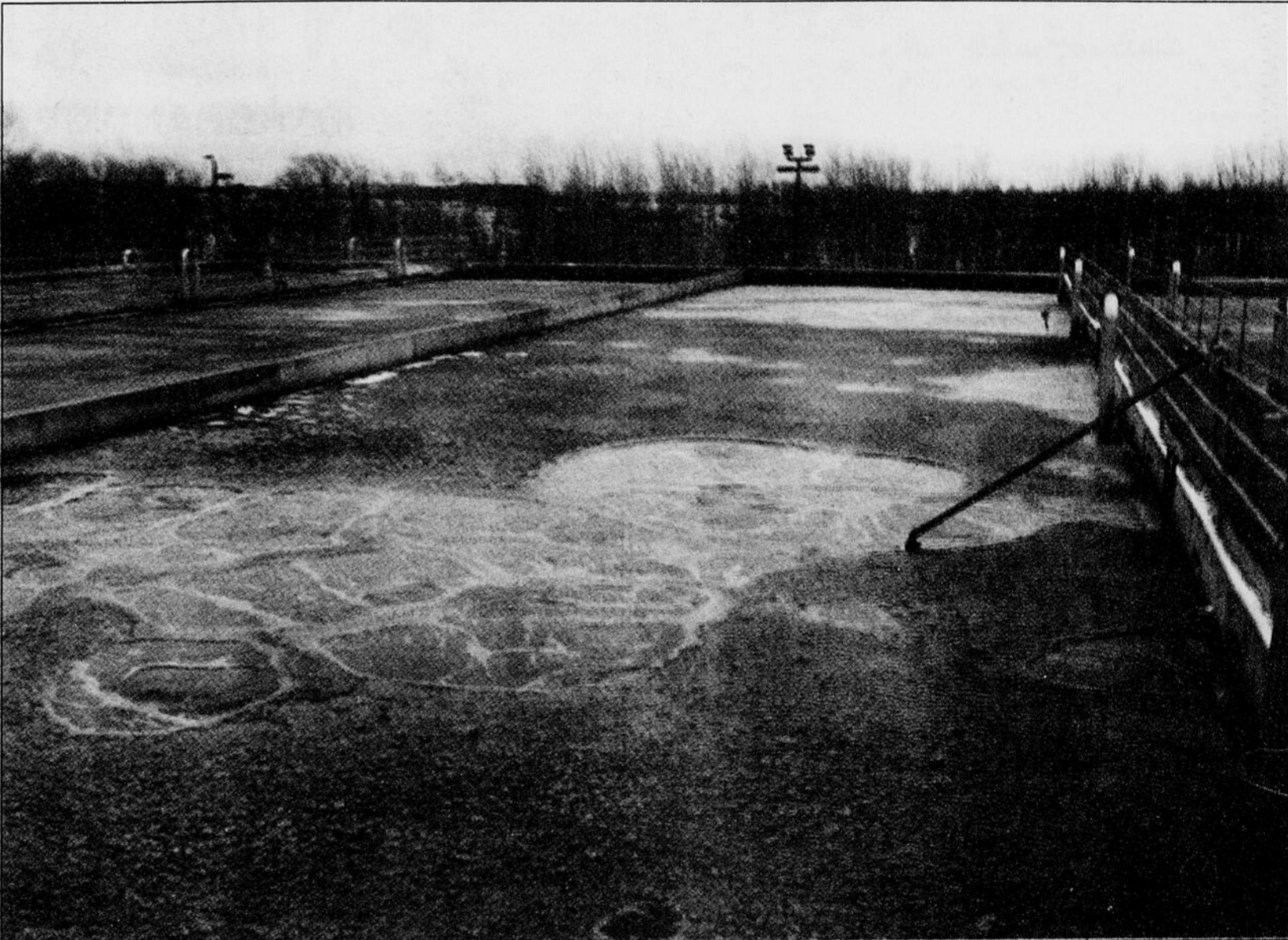
En opération depuis plus de six ans, l'usine d'épuration à Victoriaville-Arthabaska appartient toujours à la Société québécoise d'assainissement des eaux. Maintenant que la majorité des problèmes ont été réglés, la ville en deviendra officiellement propriétaire au cours de la prochaine année.

Depuis la construction de l'usine, les coûts entourant son opération quotidienne (produits chimiques, électricité, entretien, etc.) ont toujours été la responsabilité d'une entreprise privée. En 1994, cette façon de faire sera modifiée et la ville deviendra partie prenante aux opérations de l'usine, mais la firme Tekno verra à sa gestion.