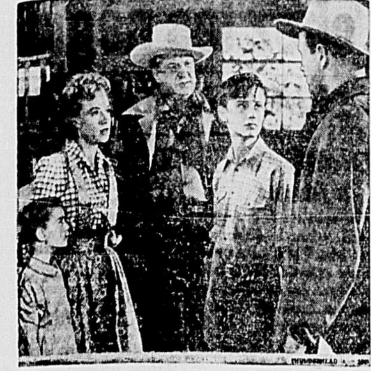
Une scène du film "Thunderhead, Son of Flicka", mettant en vedette Roddy McDowall, Preston Foster et Rita Johnson, au Capitol.