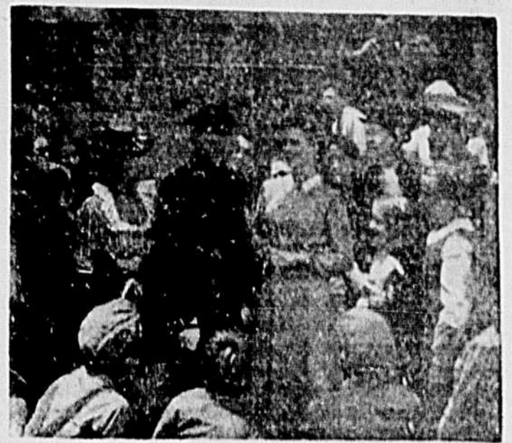
Une scène du film "A Tree Grows in Brooklyn", mettant en vedette Dorothy McGuire, Joan Blondell, James Dunn et Lloyd Nolan, au Palais.

Rédacteur de "Horizon", auteur de "Forward from liberalism", "Poems for Spain", "The Still Centre", "Life and the Poet".