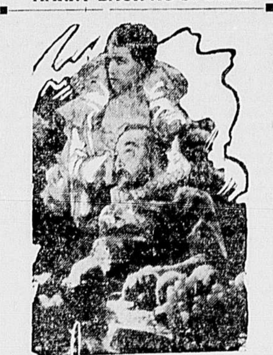
Germaine Aussey et Harry Baur dans une scène du film "Le Golem" dès samedi au Saint-Denis.