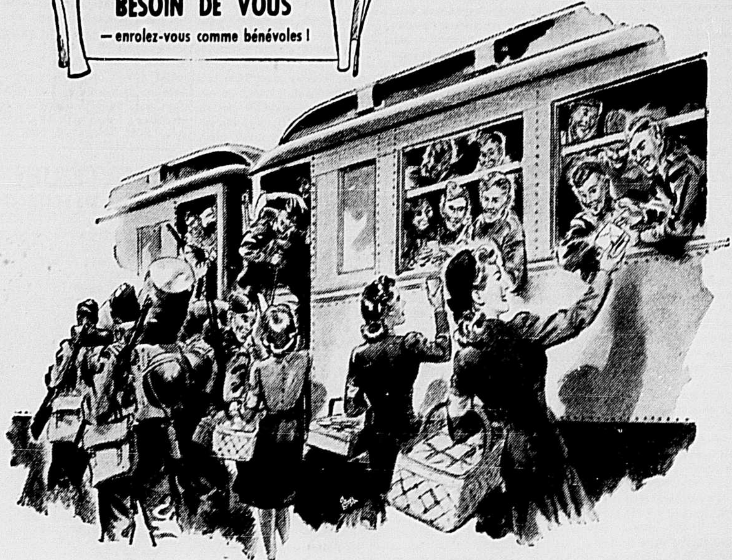
Contribution de la

ON A ENCORE BESOIN DE VOUS — enrôlez-vous comme bénévoles!