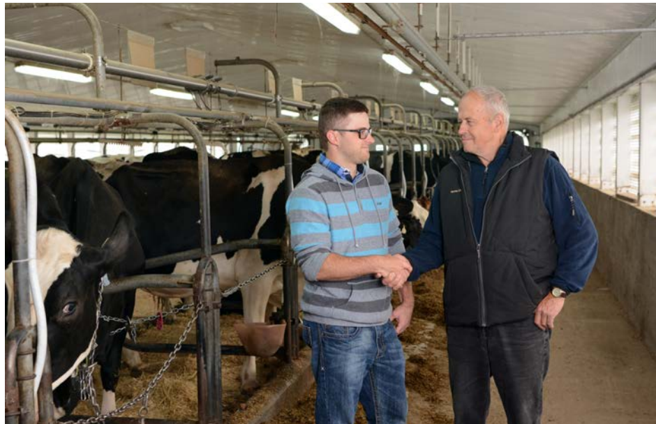
Agriculteurs et nouveaux exploitants s'entendent grâce au service L'Arterre.

Julien Dubois Initiative de journalisme local jdubois@journaldechambly.com