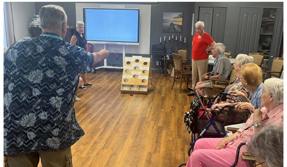
Une vingtaine d'aînés ont assisté aux tirs de leurs comparses.