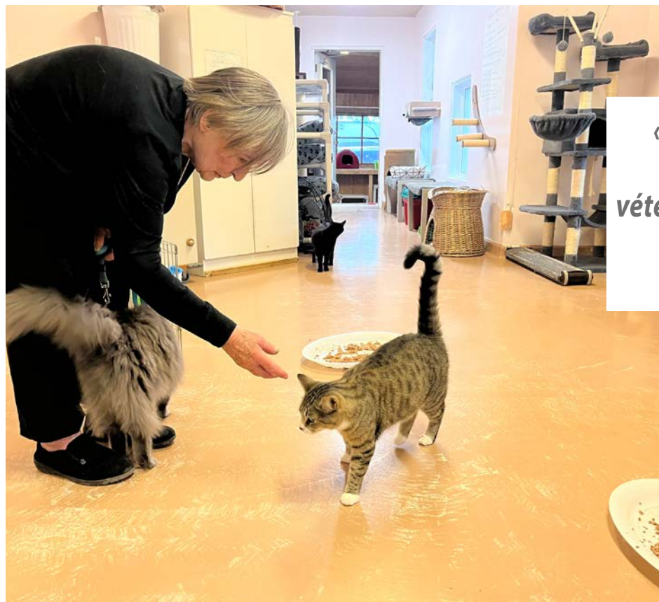
Le personnel de la SPCA Montérégie fait le maximum pour aider les animaux abandonnés ou en besoin de soins.

La dirigeante de la SPCA Montérégie pointe du doigt plusieurs cliniques vétérinaires qui ont augmenté leurs prix. « Certains vétérinaires font passer des