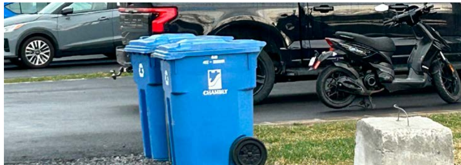
Les bonnes pratiques concernant la gestion des ordures sont désormais scrutées minutieusement.

Julien Dubois Initiative de journalisme local jdubois@journaldechambly.com