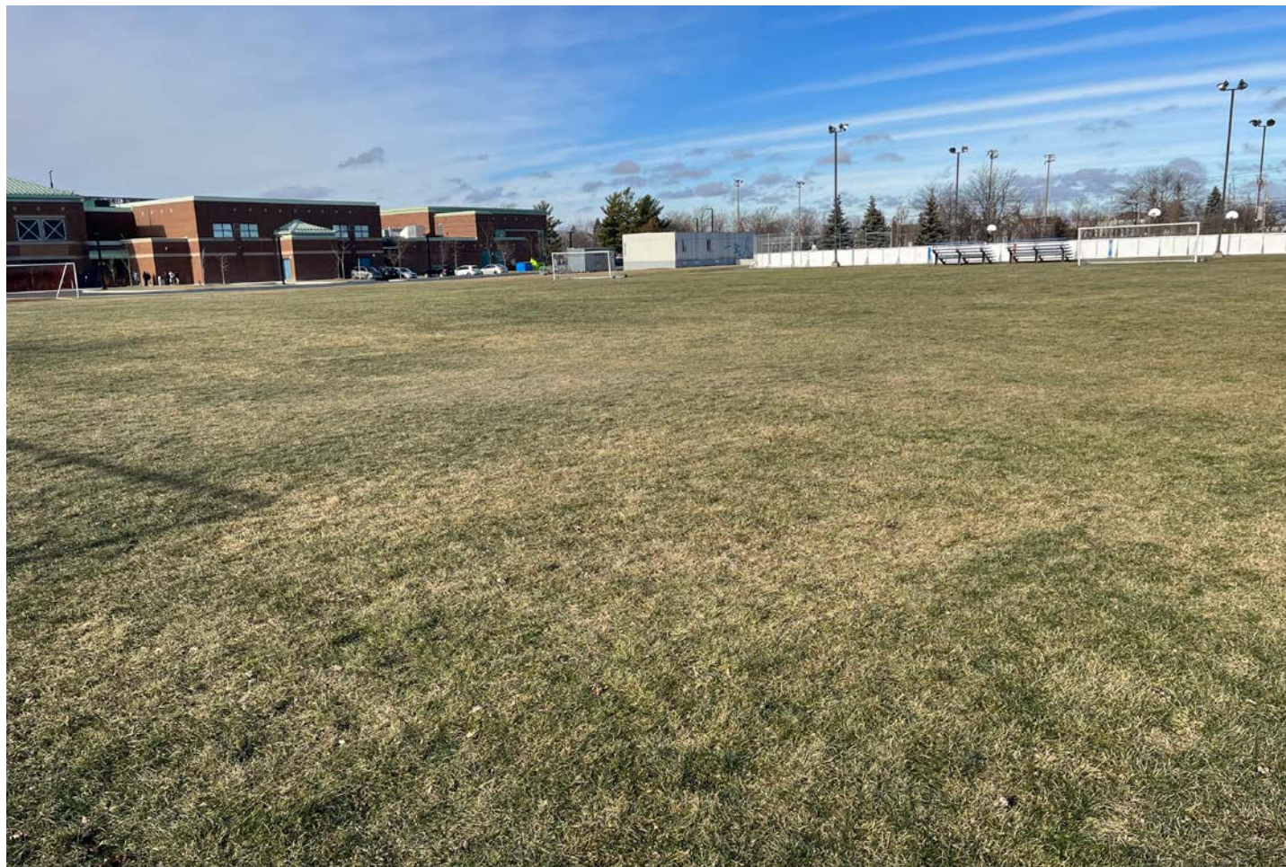
Le terrain synthétique devrait prendre place sur l'actuelle surface gazonnée de l'école secondaire.

Les travaux sur cette aire de jeux et de loisirs représentent un investissement de 16 millions $. « Nous élaborons une réfection complète du site, précise la mairesse. Cela passe par la pose d'un terrain de soccer synthétique, la création d'une zone pour adolescents, la nouvelle piscine extérieure, la zone pique-nique et un nouveau plateau sportif avec des terrains de basket-ball, de volley-ball, ainsi qu'une patinoire à bandes. Le parc Gilles-Villeneuve fait partie des priorités du conseil municipal. »