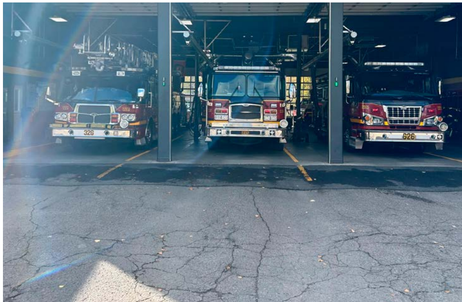
Grâce aux ententes, les différentes casernes de pompiers peuvent s'aider mutuellement.

Ainsi, en cas de sinistre du côté de Carignan, il serait possible de voir collaborer les casernes de Chambly et de Saint-Philippe. « Nous avons des effectifs présents à la caserne, précise