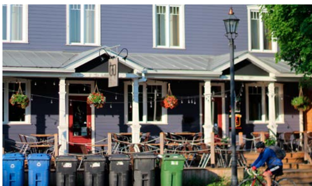
Bistro Délires et Délices.

Rue Bourgogne, le bistro Délires et Délices est un endroit prisé des Chamblyens. On y voit parfois des musiciens installés sur l'antique galerie, jouant pour le plus grand plaisir des habitués et des passants. Cette ancienne demeure est le lieu de naissance de la « Coco Chanel du Québec ».