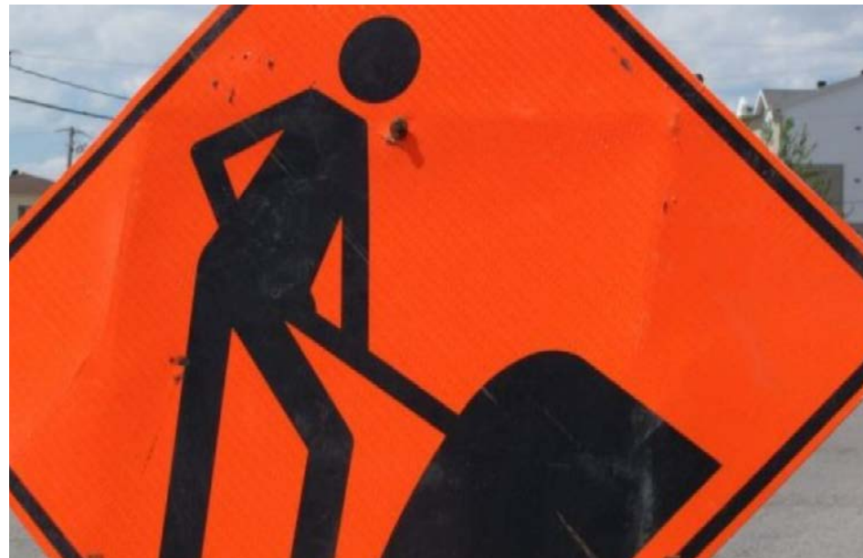
La limite de vitesse permise est abaissée à 80 km/h dans la zone de chantier.

Les travaux pourraient être reportés ou prolongés en raison de conditions météorologiques défavorables ou de