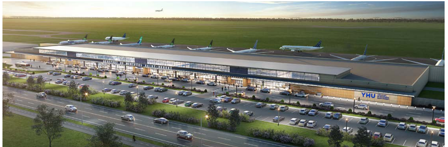
Maquette de la future aérogare de MET, qui devrait voir le jour à la fin de l'année.

Pour les opposants au projet d'expansion de l'aéroport « DASH-L (la structure gestionnaire de l'aéroport) réalise ainsi une nouvelle opération marketing pour faire oublier que son projet n'a jamais été déposé avec les études pertinentes nécessaires pour être évalué publiquement, comme exigé par deux consultations publiques en 2022, et qu'ainsi, il n'y a nullement d'acceptabilité sociale. Une fois de plus, il s'agit d'un pur acte de communication, sans réalité tangible, a indiqué dans un communiqué la Coalition Halte-Air. Ce énième