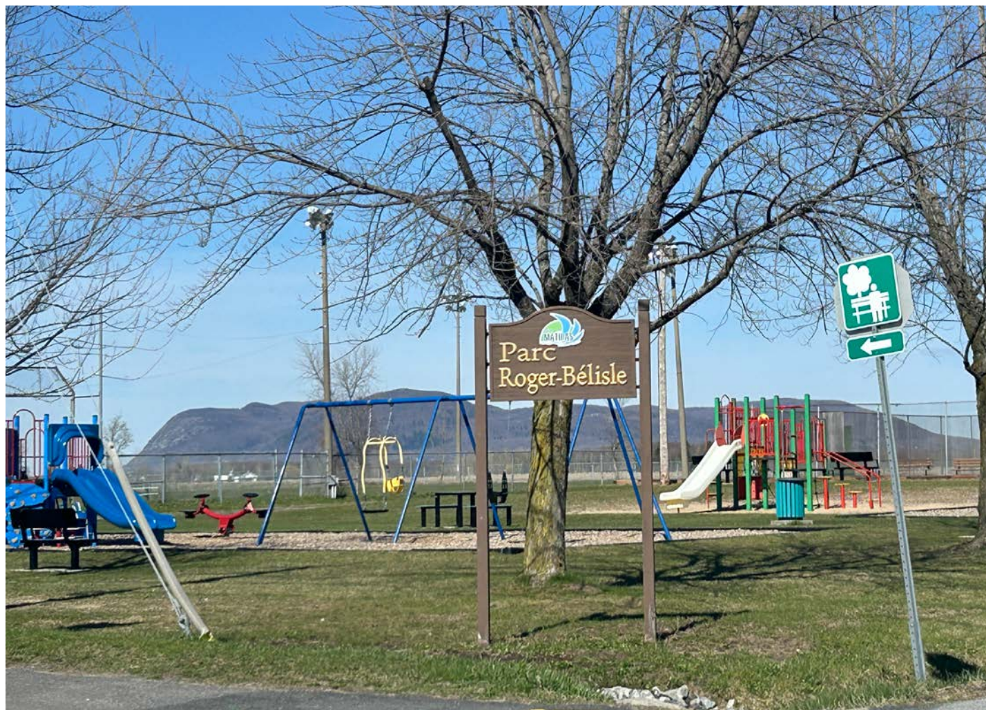
Le parc Roger-Bélisle accueillera la Fête des citoyens de Saint-Mathias-sur-Richelieu.