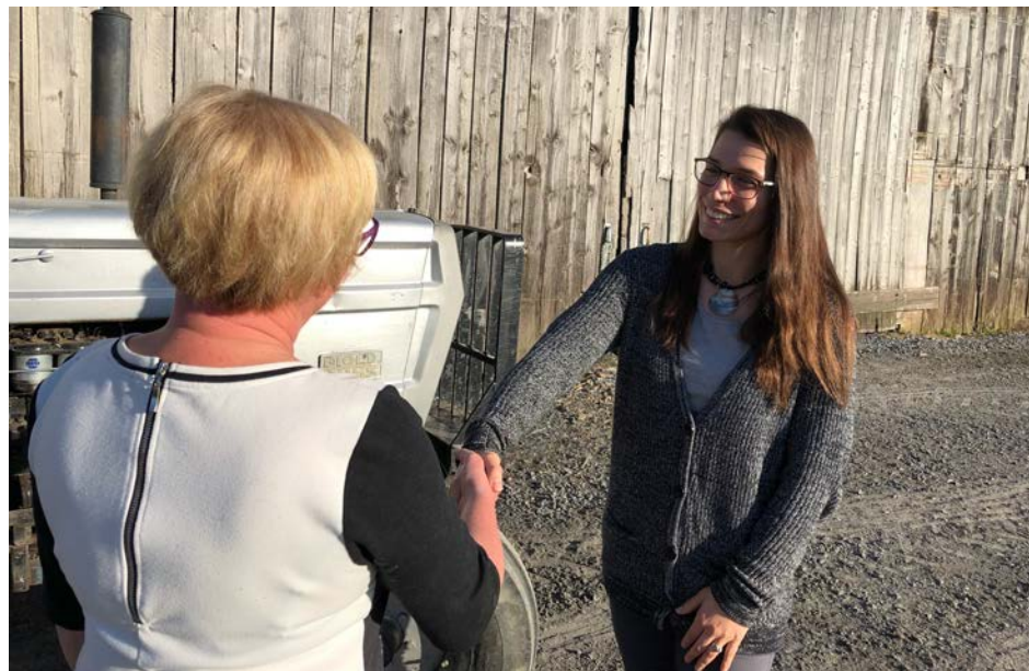
Que ce soit pour un élevage ou de la culture, les jumelages sont toujours possibles.

vail qu'il vise. Parmi les 325 personnes souhaitant s'établir dans la région et qualifiées, plusieurs ne vivent pas ac-