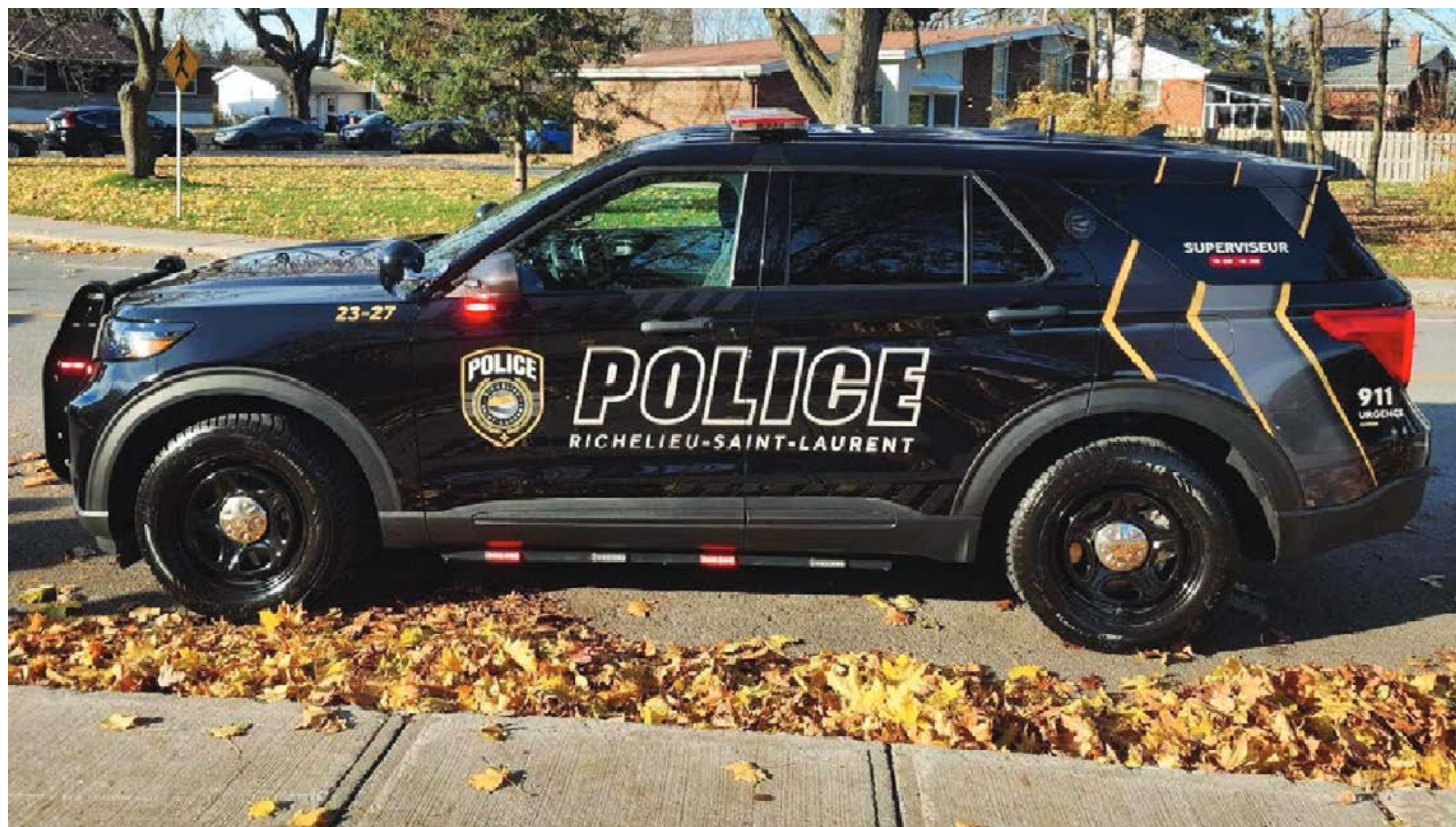
Le 911 a reçu 65 424 appels concernant le territoire de la Régie en 2023.

À Sainte-Julie, ce sont 5 531 appels au 911 qui ont été effectués, ici encore au moins 600 appels de plus qu'en 2022.