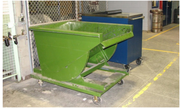
Bac pour le papier et bac pour les métaux