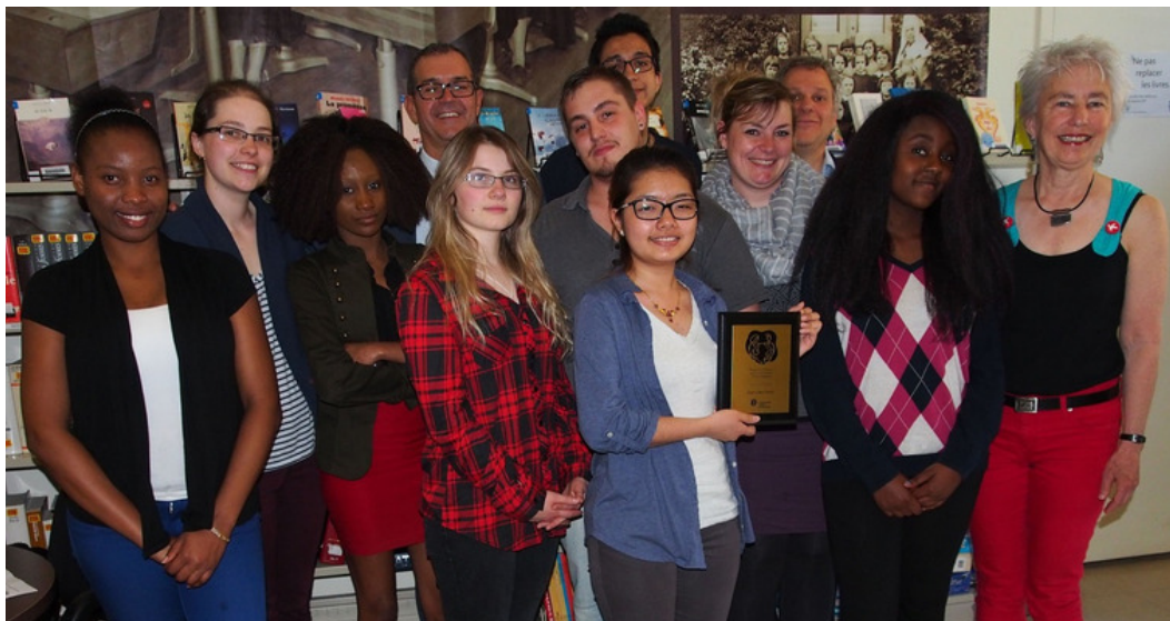
Toute l'équipe de Ville en vert