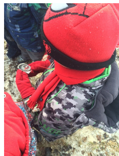
S'orienter avec une boussole