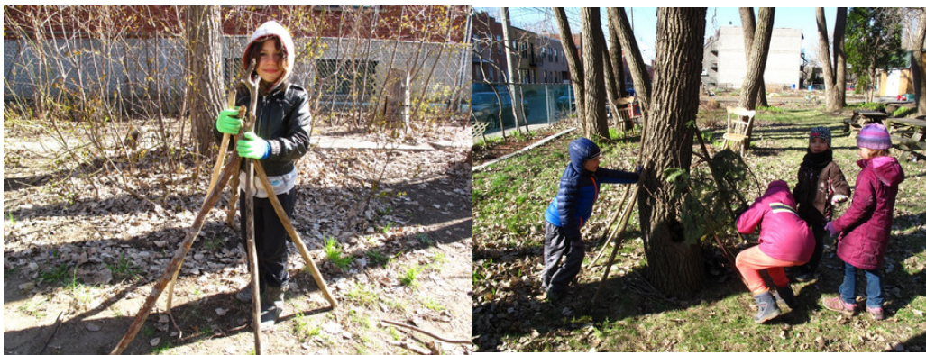
La construction d'un abri

Carole Marcoux, conseillère pédagogique en environnement Commission scolaire de Montréal