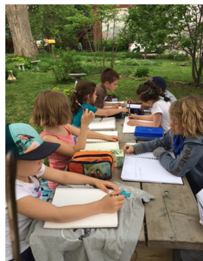
Des jeunes... et des traces

Maths et sciences, grandeur nature a permis aux élèves de construire de façon positive leur rapport au monde et de développer leur sentiment de parenté avec la nature. Ce faisant, ils ont fait des liens entre leur environnement et la science, la technologie et les mathématiques. Ces disciplines ont maintenant pour eux une résonance concrète qui transcende les apprentissages théoriques et livresques faits en classe. Pour eux, la science et les mathématiques sont associées à l'exploration active de la nature, une expérience habituellement très agréable pour les jeunes. Une telle approche teintera sans doute favorablement leur perception de ces disciplines, ce qui les motivera à optimiser leurs apprentissages en science et en mathématiques.