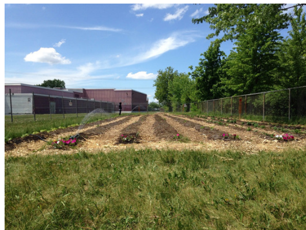
Le jardin des Patriotes

Évidemment, un projet d'une telle envergure ne peut pas se faire sans la contribution de nombreux partenaires. C'est ainsi qu'elle a entraîné dans son sillage jardinier des élèves du programme de formation préparatoire au travail, d'autres du comité vert et de la brigade verte, l'organisme Ça pousse! – dépôt alimentaire NDG, PARI Saint-Michel - Éco-Quartier Saint-Michel/François-Perrault, le ministre du Développement durable, de l'Environnement et de la Lutte aux changements climatiques, le volet alimentation de l'organisme Vivre St-Michel en santé, l'arrondissement Saint-Michel, la fondation TD des amis de l'environnement, Toyota Evergreen, la fondation Monique Fitz-Back et la caisse Desjardins du Centre-Est.