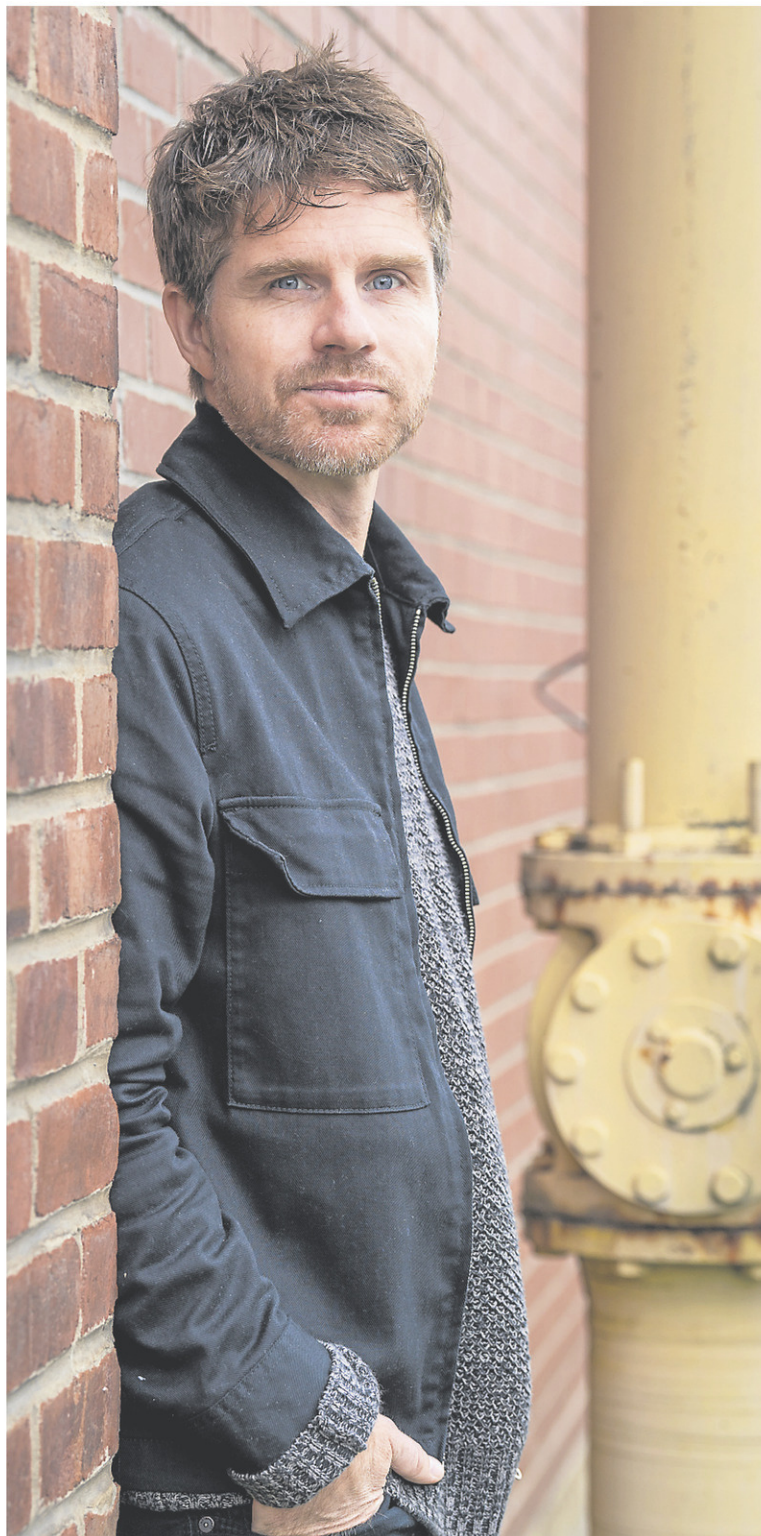
Pendant sa tournée solo de 2021-2022, Vincent Vallières s'est mis à écrire ses états d'âme et à les publier sur le web. Il a fini par se faire prendre au jeu.