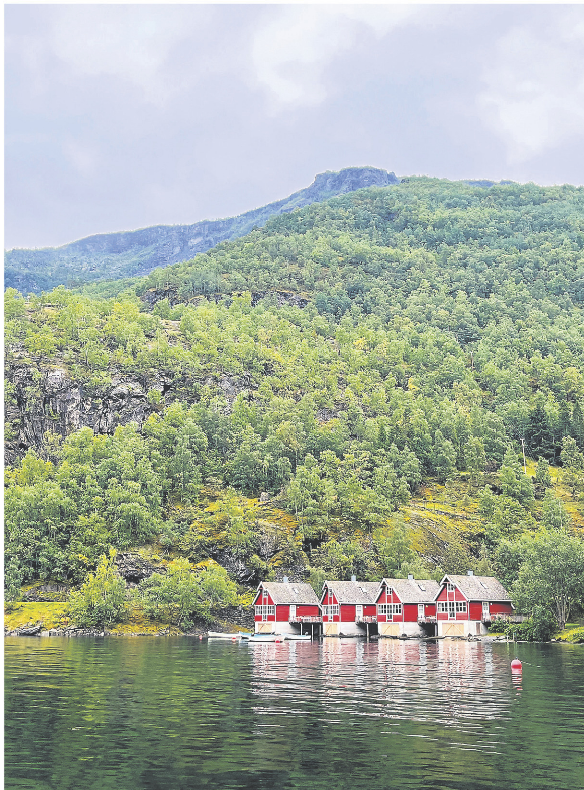
Les petites maisons rouges de Flâm s'inscrivent dans un paysage typique de Norvège.

Le sifflement du train annonce déjà le départ vers la petite ville de Flâm, bien lovée dans le fjord Aurlandsfjorden, point de départ pour une croisière fort prometteuse. Flâm, c'est à la fois un village où il n'y a rien à faire avec les deux heures qu'on a, autrement