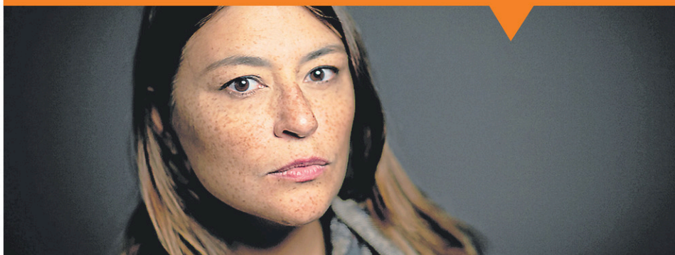
Elisapie