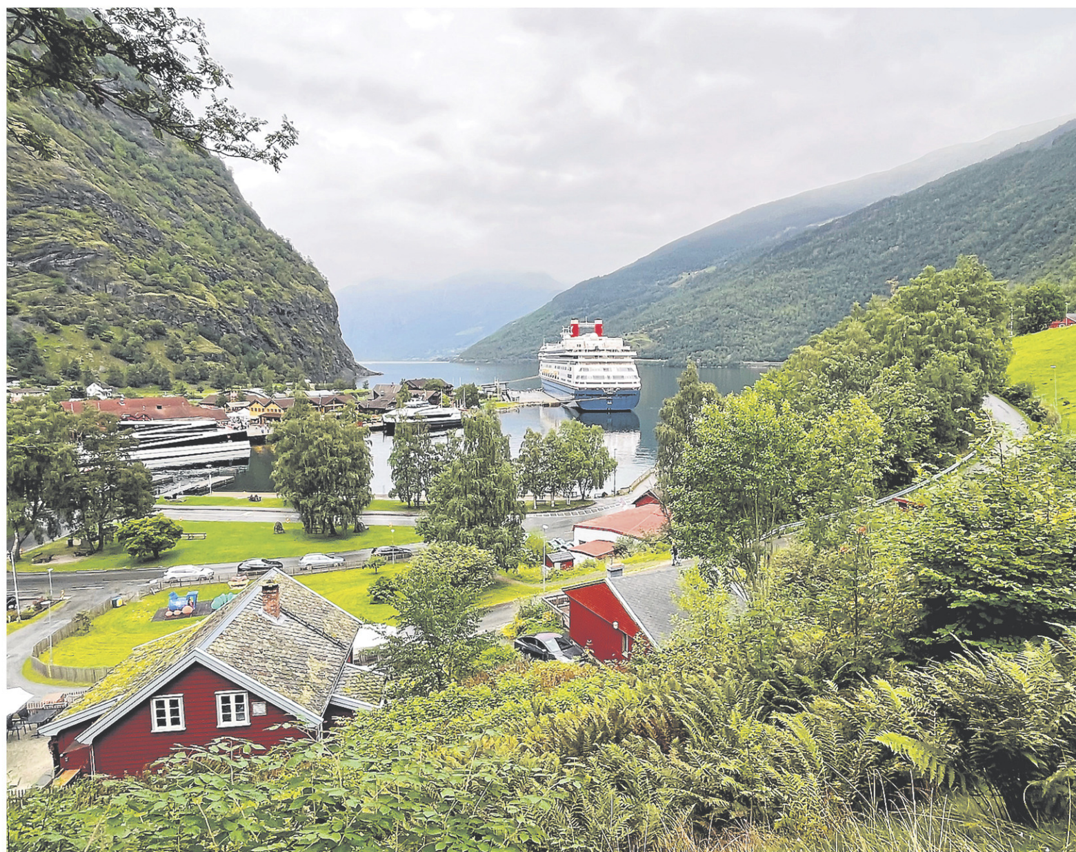
Flåm est l'un des points de départ pour explorer les fjords.