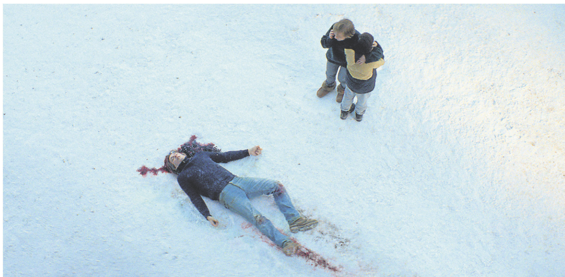
Rarement un thriller nous amène dans tous les aspects du crime comme Anatomie d'une chute .

rôle. Dans la plupart des scènes, la cinéaste change de cadre pour offrir un point de vue différent, afin que le spectateur puisse se mettre à la place de différents protagonistes. À un moment, nous sommes dans le point de vue de Sandra, interprétée par la talentueuse Sandra Hüller; à un autre moment, nous sommes les policiers, les médias, le juge, les avocats. Bref, tout le monde y passe.