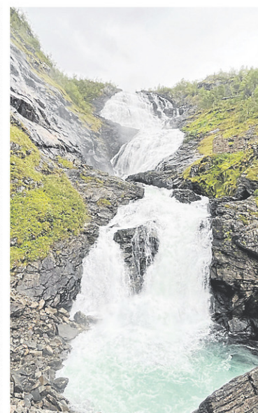
Les chutes de Kjøfossen sont l'un des points d'intérêt du parcours en train de Flåm.

Sauf que par la voie des airs, on ne voit presque rien. Ou pas assez. Alors d'aucuns considéreront le populaire « Norway in a nutshell », un tour autoguidé pour en voir beaucoup trop, franchir une trop grande distance en une seule et même journée. Cette option, à environ 200 $ CA par personne, n'est rien de plus qu'un agrégat de titres de transport,