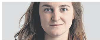
VALÉRIE MARCOUX Le Soleil

Cette année, l'Association québécoise de l'industrie du disque, du spectacle et de la vidéo (ADISQ) annonce un recensement record de 263 albums. La musique adulte contemporaine, la pop et le rap sont les styles musicaux les plus représentés par cet échantillonnage. Mais, surprise, quel genre vient talonner ce trio bien établi? La musique instrumentale.