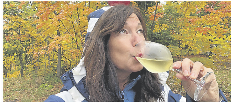
Pomme en tête, pommes en fête.

Avec ses notes de fleur mauve, de pêche et de citron confit qui s'assemblent dans une texture soyeuse à la finale acidulée, ce pinot gris du vignoble canadien Mission Hill est gastronomique à souhait. Le tiers de la cuvée a connu un élevage en fût de chêne français. Cela ajoute une complexité qui fera honneur à un flan de porc croustillant, fumé au bois de pommier et servi avec une sauce flambée au calvados.