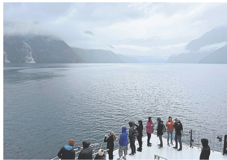
Même dans la brume, les fjords de Norvège sont impressionnants.

que de dépenser pour une collation ou un repas en attendant le prochain départ, et à la fois un paysage typique des cartes postales, avec ses quatre maisons rouges isolées sur la berge.