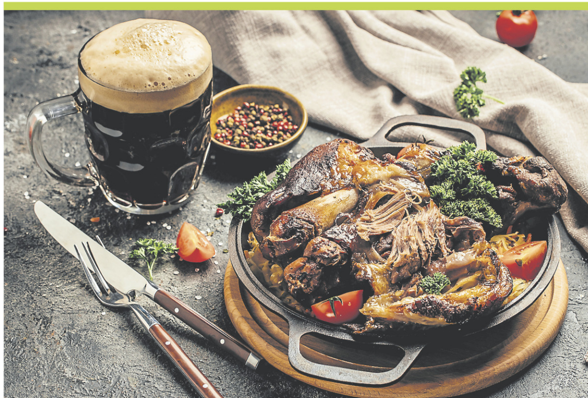
La bière se prête bien aux plats cuisinés durant la saison froide.