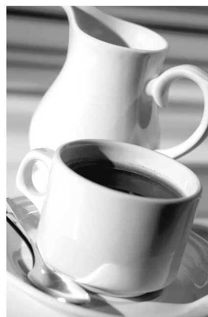
Un café bu dans un climat de détente suffit à briser le stress.