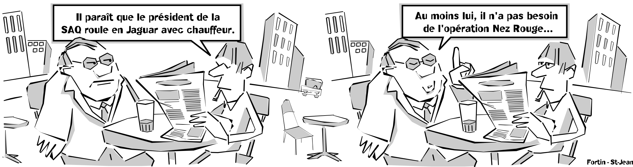
Fortin - St-Jean