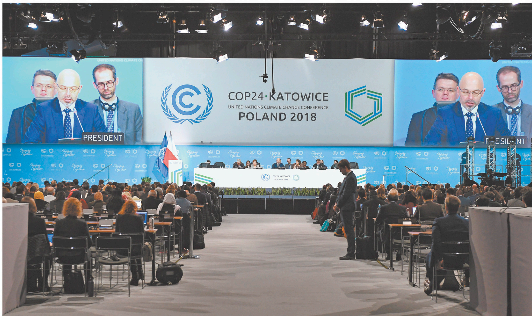
La 24 e Conférence des Parties à la Convention-cadre des Nations Unies sur les changements climatiques à Katowice, en Pologne, en décembre dernier IFDD

Créé en 1988, l'IFDD se nommait à l'époque Institut de l'énergie ayant en commun l'usage du français. L'organisme se concentrait surtout sur les questions énergétiques. En 2013, après le sommet Rio+20 et la préoccupation grandissante pour le développement durable, l'organisme a changé de nom pour celui d'Institut de la Francophonie pour le développement durable. Depuis ce temps, il fait la promotion des multiples facettes du développement durable, de diverses façons. En créant des partenariats, en publiant des guides (destinés aux décideurs, par exemple), des revues spécialisées et des documents scientifiques et techniques, en français. Ou encore en