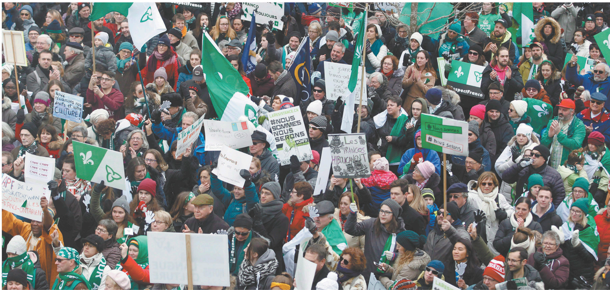
Manifestation à Ottawa contre les coupes du gouvernement ontarien dans les services aux francophones le 1 er décembre dernier