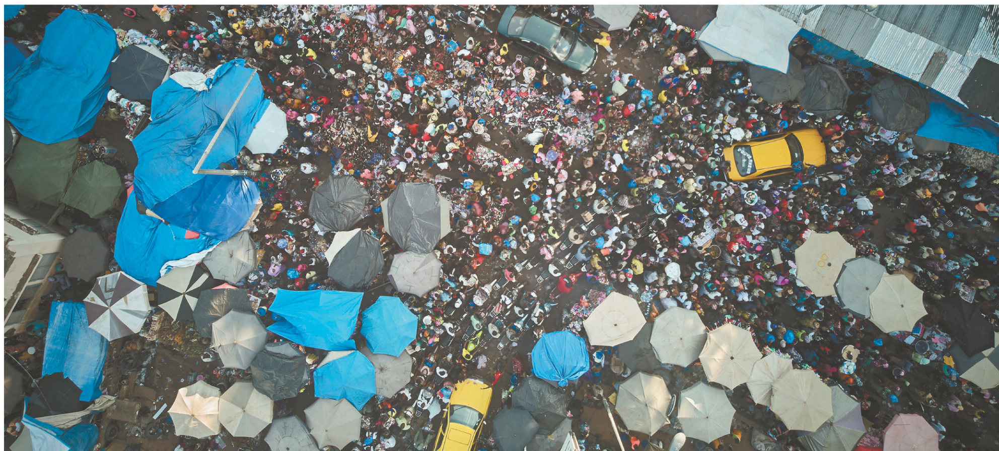
Vue aérienne du marché central de Bamako, au Mali. Le Mali fait partie de ces pays d'Afrique subsaharienne où le français continue de progresser.

À l'heure où l'anglais s'impose comme langue internationale, on pourrait penser que le français perd peu à peu du terrain. Or, ce dernier serait plutôt en progression, nous apprend l'ouvrage La langue française dans le monde .