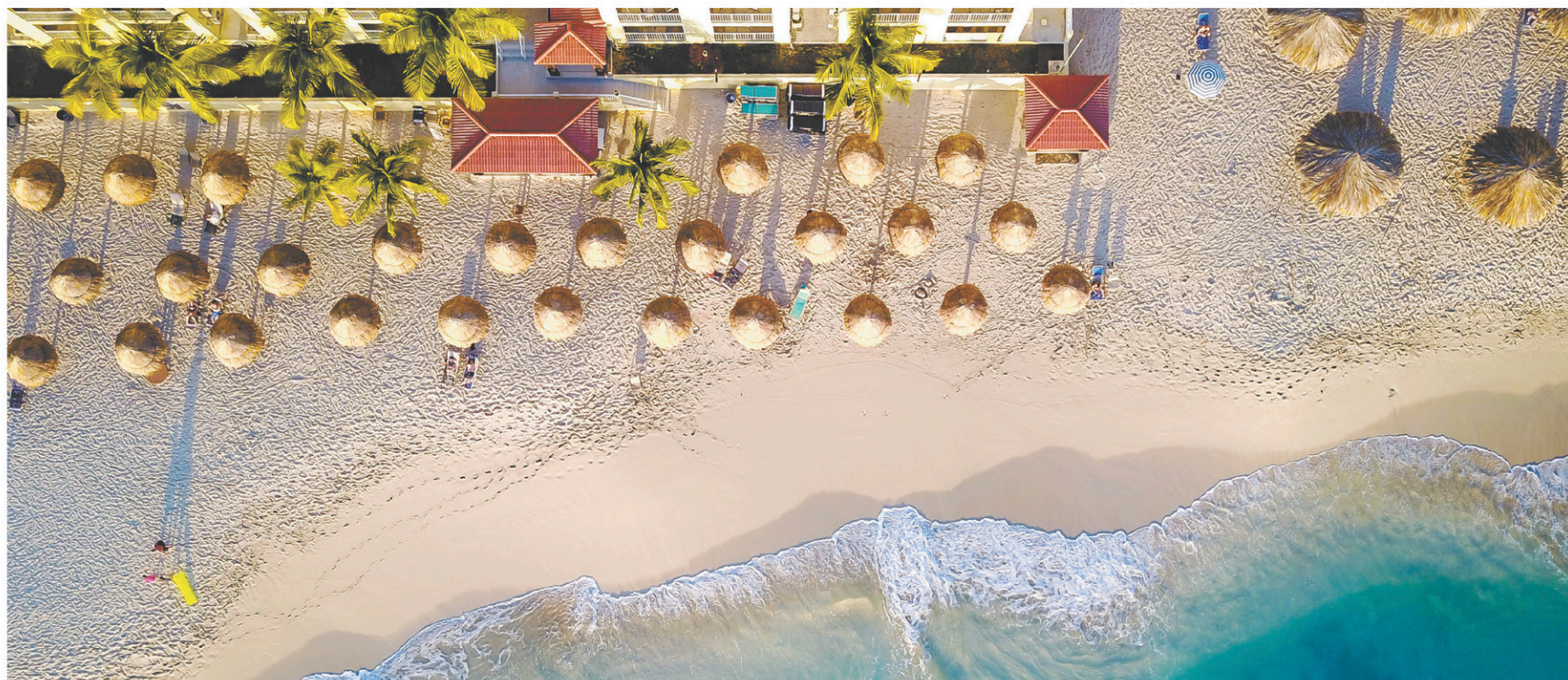
Le français est très présent aussi dans les Caraïbes en raison du mouvement de colonisation française avec les départements et régions d'outre-mer que sont la Martinique et la Guadeloupe, puis les collectivités d'outre-mer que sont Saint-Martin (notre photo) et Saint-Barthélemy.

«Nous souhaitons rejoindre le plus de francophones et de franco-