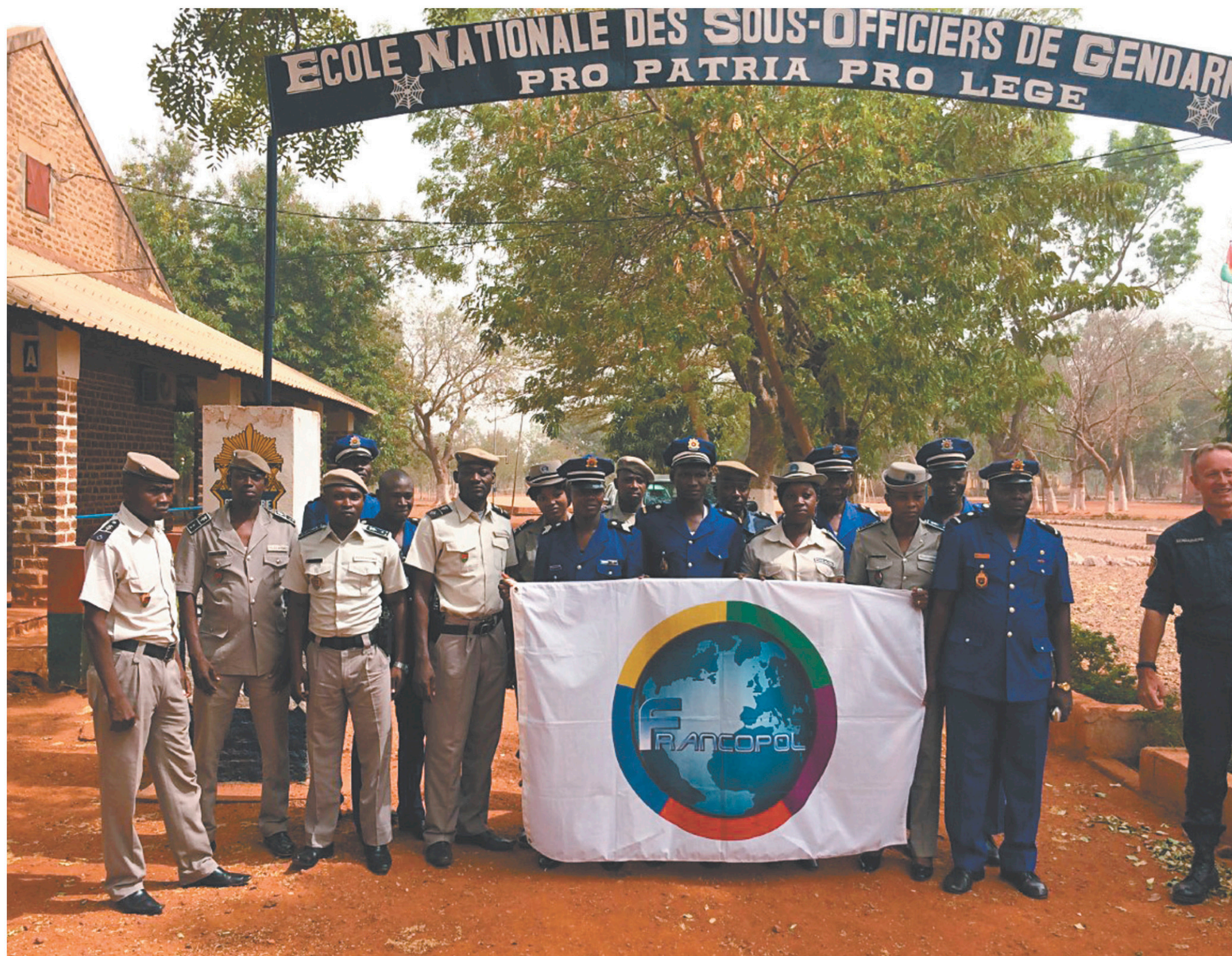
Collaboration de FRANCOPOPOL au projet PAX pour la lutte contre l'exploitation sexuelle des enfants au Maroc FRANCOPOPOL

Acteur important au sein de la francophonie, le Québec exerce un rôle primordial en matière de droits de l'Homme, de démocratie et de sécurité publique. Au fil des années, des institutions québécoises ont donné un coup de pouce dans la création d'organismes et de réseaux membres. Coup de projecteur sur quelques initiatives.