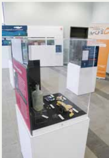
Une exposition historique et archéologique sur les origines de Longueuil.