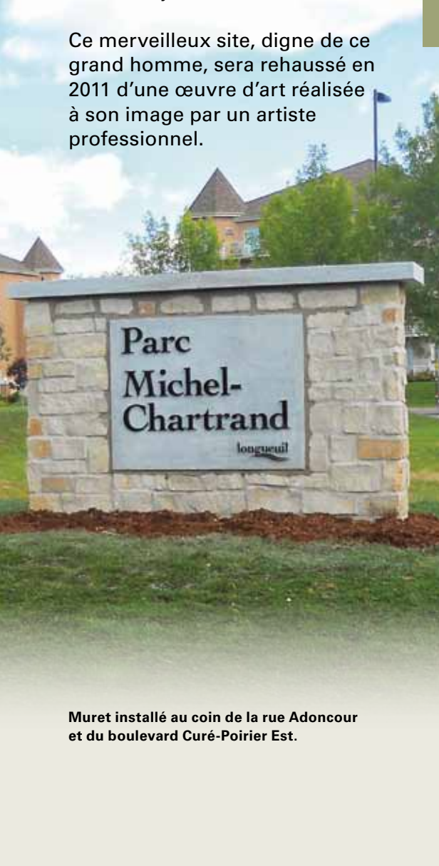
Muret installé au coin de la rue Adoncour et du boulevard Curé-Poirier Est.

Pour identifier les limites du parc Michel-Chartrand, trois murets sont présents aux principales entrées du parc. De plus, deux plaques didactiques ont été installées, soit une qui commémore la nouvelle dénomination du parc, et que l'on retrouve près des trois lacs, ainsi qu'une autre qui dresse l'histoire de cet important boisé longueuillois et qui est aménagée près de l'entrée de la rue Adoncour.