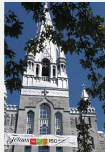
L'église de Saint-Hubert, située au 5310, chemin de Chambly, était pavoisée pour l'occasion.