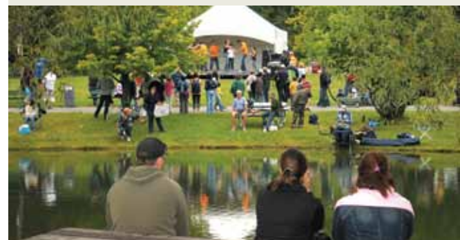
Près de 5 000 personnes ont profité de la Fête du citoyen, le 12 septembre dernier, pour s'amuser dans ce magnifique boisé qu'est le parc Michel-Chartrand.