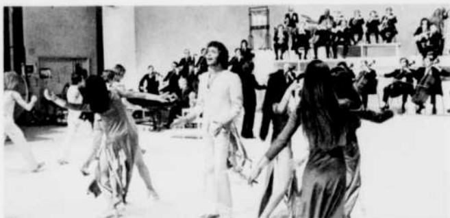
Jacques Boulanger aurait-il quitté Boubou pour revenir à Zoom?