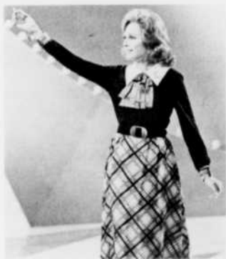
Michelle Tisseyre accueillerait-elle des invités à Music-hall comme elle l'a fait pendant tant d'années?

... notre caméra a capté sur le vif de multiples vedettes dont la présence rappelle de nombreux souvenirs et suscite une foule de questions.