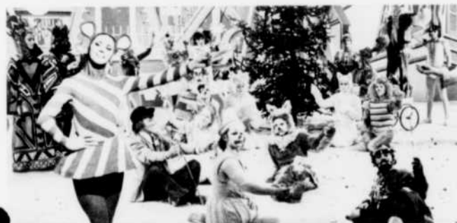
La Souris verte, Grujot, Gobelet, le Pirate Maboule, Pico et toute la ribambelle de personnages pour enfants célèbrent-ils un événement spécial?