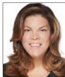
Kateri Champagne Jourdain

Ministre des Ressources naturelles et des Forêts Ministre responsable de la région de la Capitale-Nationale