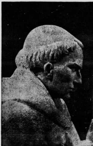
Saint Bernard par Belloni