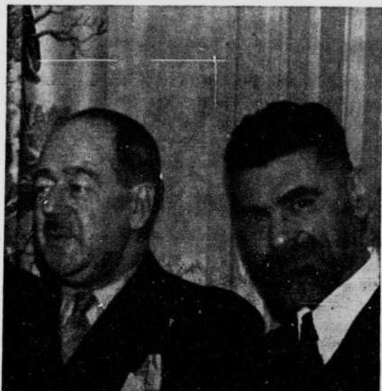
Ringuet et Alfred Des Rochers

saurions en disconvenir. Mais n'est-ce pas l'oublier et minimiser singulièrement le sens de la quête humaine que de la ramener à l'échelle d'une démarche futile et sans issue ? Comme Ringuet nous eût livré de l'homme éternel une image plus parfaite s'il ne s'en était pas tenu avec une aussi manifeste complaisance à la peinture d'un univers dont les individus demeurent irrémédiablement voués à « la géhenne du réel » ! Nous dira-t-il un jour pourquoi il a voulu que chacun de ses personnages, à l'instar du héros du conte intitulé l'Immortel , fût perdu, sans rémission, plus perdu pour n'avoir qu'entrevu le triomphe de l'homme sur l'insatiable vautour ? Ce serait là, certes, une confiance de nature à orienter les prospections de la critique dans son exégèse de l'œuvre, mais l'univers romanesque de Ringuet ne s'en trouverait pas pour autant illuminé et ouvert à l'invasion de l'Absolu.