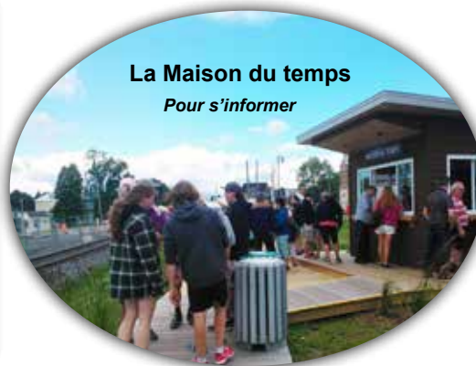
La Maison du temps