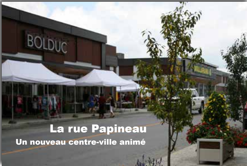
La rue Papineau Un nouveau centre-ville animé