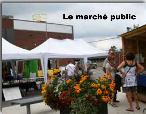
Le marché public