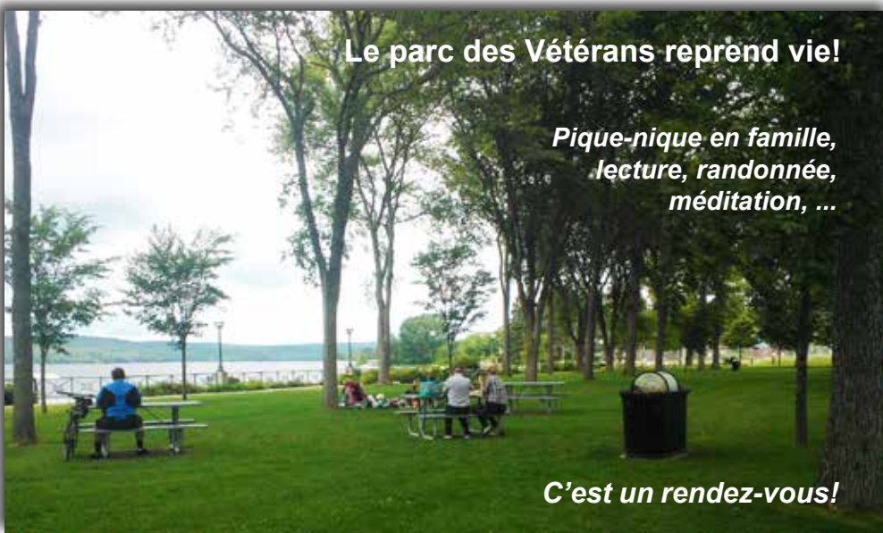
Le parc des Vétérans reprend vie!