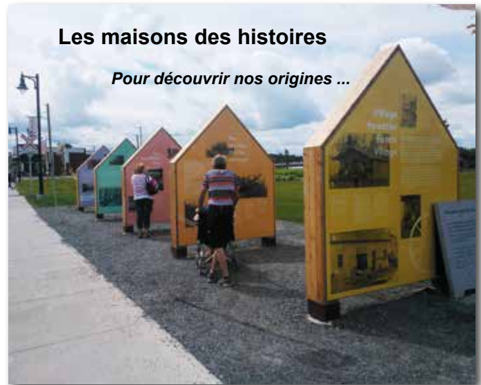
Les maisons des histoires