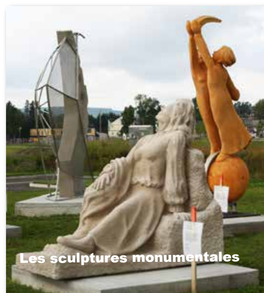
Les sculptures monumentales