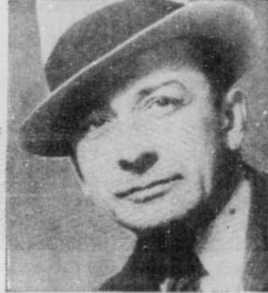
L'acteur s'affirme, il porte feutre...