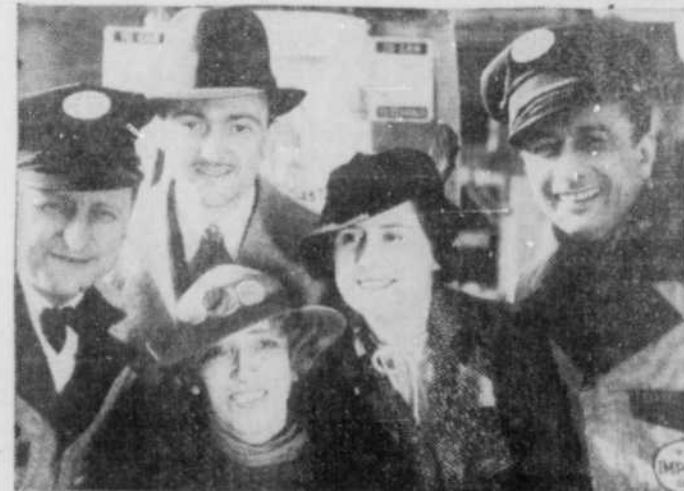
Cinéma tourné à New-York. Toujours le même sourire (1935).