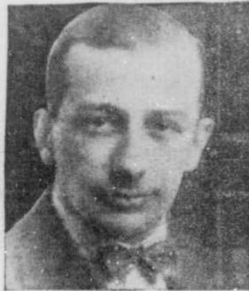
En tournée, Lewiston, Maine