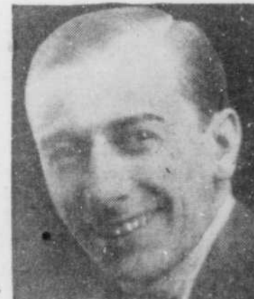
A la Soc. Canadienne d'Opérette. Il est toujours souriant.