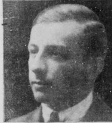
1919, il débute au théâtre "pour de vrai!"