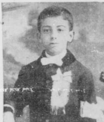
"Le plus beau jour de sa vie..."