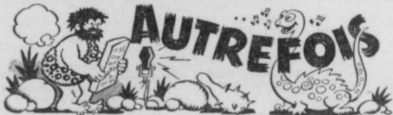
(Sous cette rubrique nous ferons revivre quelques-uns des meilleurs souvenirs des premières années de CKAC)

La maman de Pierrot faisait comme toutes les mamans du quartier son lavage le lundi. Pierrot lui, devait attendre au vendredi pour se faire savonner par sa famille pour les mauvais coups de la semaine. Il a jugé que mieux valait tout faire d'un seul coup et le voici en train d'étendre son horloge. C'est une autre de ses blagues dont il est coutumier et comme il continue d'en faire à tout le monde tous les lundis soir, à 8 heures au poste CKAC.