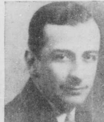
Au Stella, c'est le beau Brunel! Sortez vos mouchoirs!