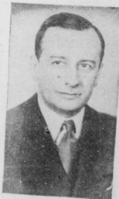
Encore très jeune, on dirait un débutant.