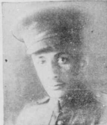
Le défenseur de son pays... à Valcartier, 1918