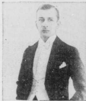
Le premier grand rôle. Hum!