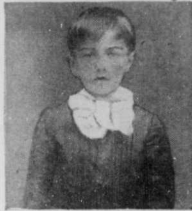
A 7 ans, c'est un homme.