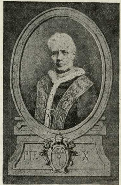
SA SAINTETE PIE X

Sa Sainteté Pie X (Joseph Sarto), Vicaire de J.-C., 264ième successeur du Prince des Apôtres, Pontife suprême de l'Eglise Universelle, Patriarche d'Occident, Primat d'Italie, Métropolitain de la province Romaine, Archevêque et Evêque de Rome, Souverain des Domaines temporels de la sainte Eglise, né à Riese, diocèse de Trévis, le 2 juin 1835; ordonné prêtre le 18 septembre 1858; vicaire à Tombolo; Curé de Salzano, 1867; Evêque de Mantoue, le 10 novembre 1884; Cardinal-prêtre du titre de Saint Bernard Alle Terme , le 12 juin 1893; Patriarche de Venise, le 15 juin 1893; élu Pape le 4 août 1903, couronné le 9 août 1908.